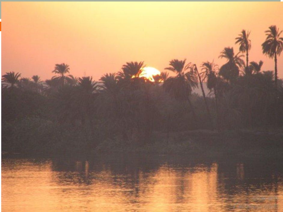
Нил на закате солнца.

Слава тебе, Нил приходящий чтобы оживить Египет.