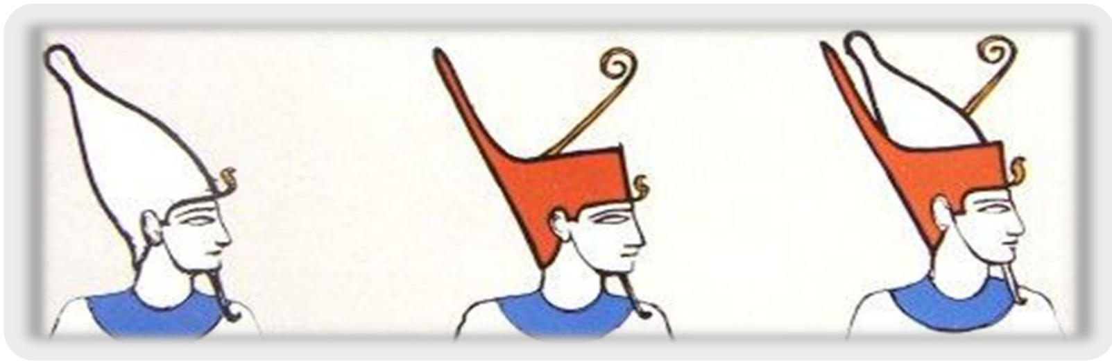
Короны царей Южного и Северного Египта, двойная корона фараона