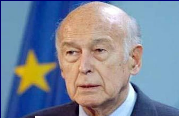
Валери Жискар д'Эстен