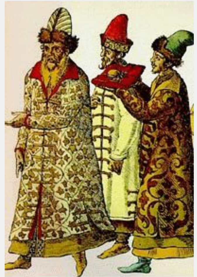
Русские бояре. Фрагмент раскрашенной гравюры XVI в.

Ключевский сталкивается и с определенными трудностями при написании своего труда. Так, ему не всегда хватало достаточно данных, чтобы выяснить все отличия между Думой разных периодов. Например, при рассмотрении Думы северных уделов он замечает, что «предпринимаемая попытка изобразить управление удельного княжества, наверное, несвободна ни от недомолвок, ни даже от значительных обмолвок»