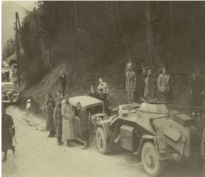
Немецкие войска в Австрии

1933 – Германия потребовала «равенства вооружений».