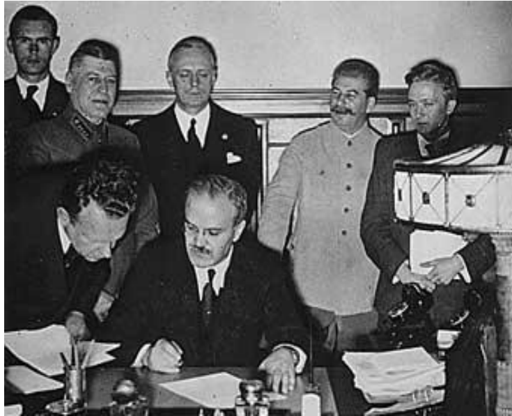
В. Молотов подписывает пакт о ненападении

Весна 1939 – советско-англо-французские переговоры.