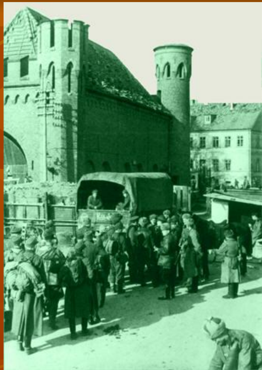
Немецкие пленные у Закхаймских ворот.