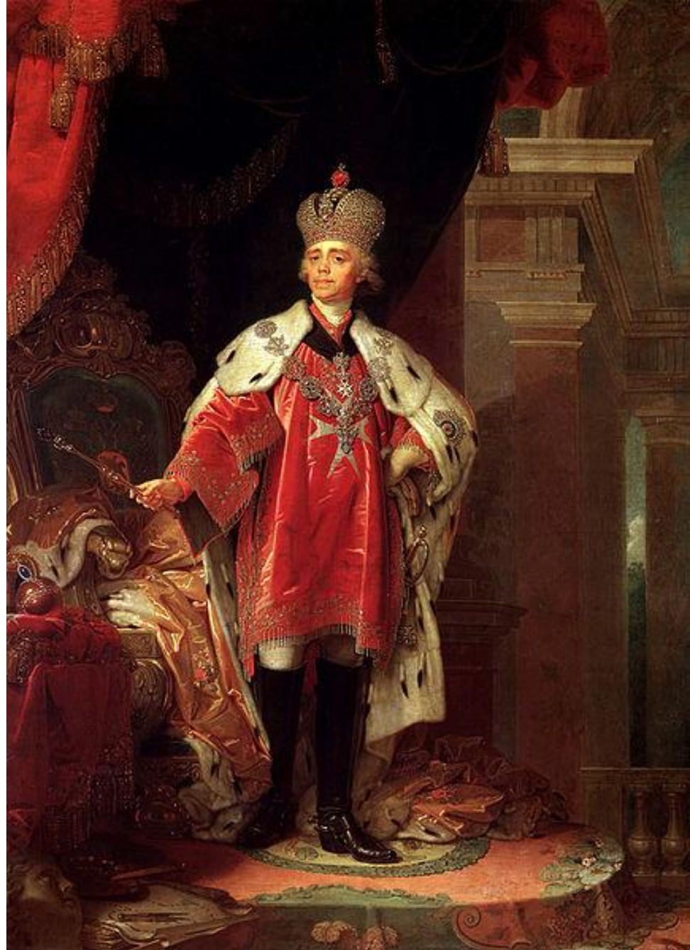
Боровиковский В. Л. Портрет Павла I. около 1800 г

Научил сына совмещать душевную любовь к человечеству с практической заботой о ближнем.