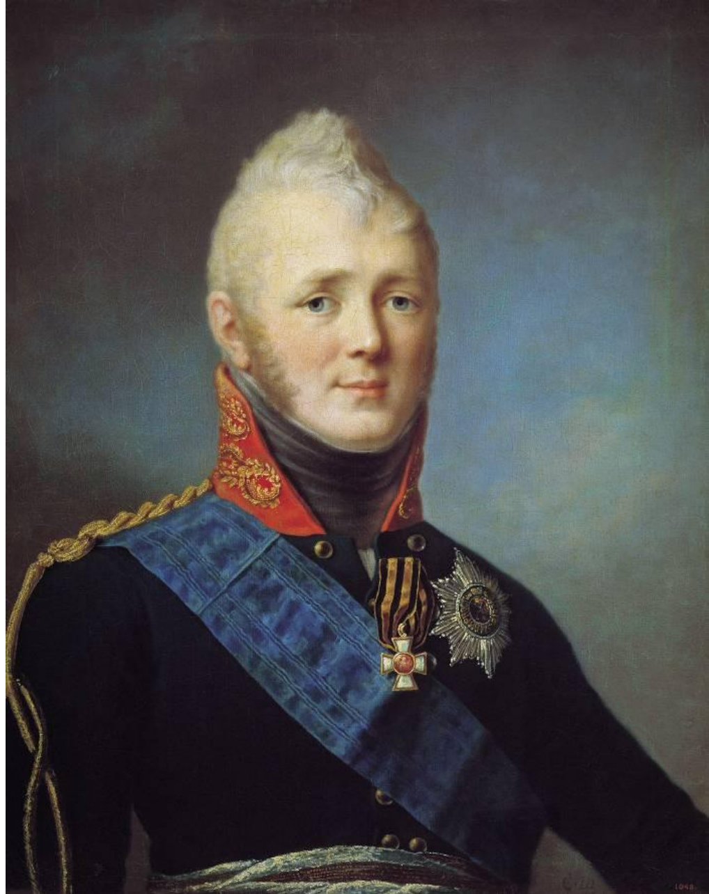
Щукин С.С. Портрет Александра I. начало 1800 - х

Умело лавировал между ними, руководствуясь идеями обоих.