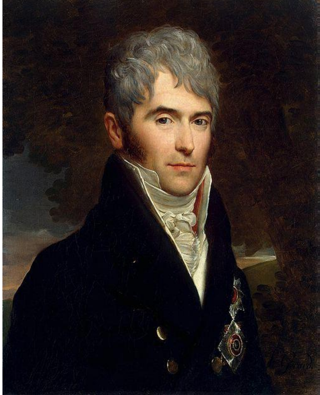
Автор Ф. Жерар, 1809 год.