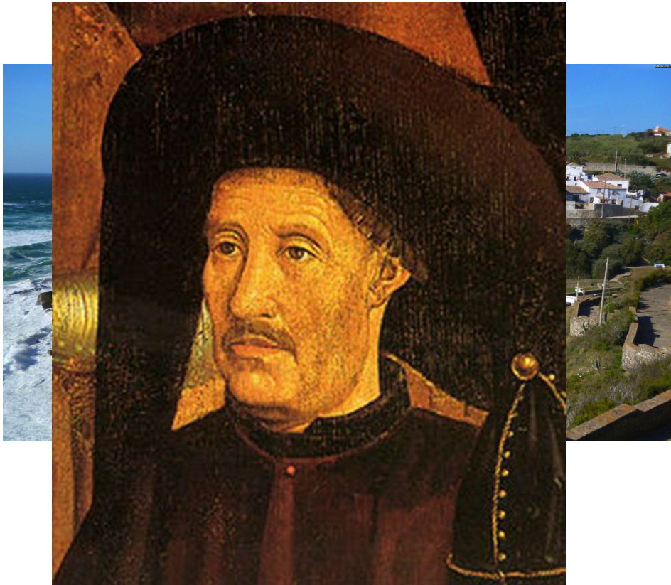
Генрих Мореплаватель (1394-1460)