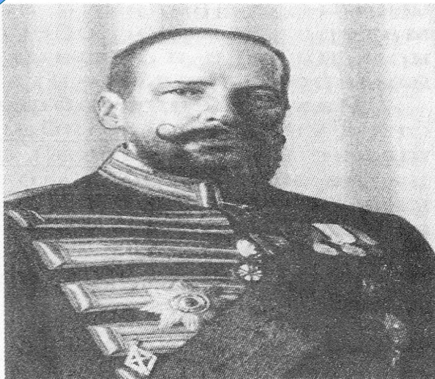
П. А. Столыпин.