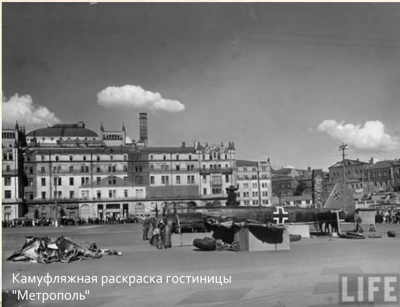
Камуфляжная раскраска гостиницы "Метрополь"

Камуфляжная раскраска появилась на всех крупных зданиях, которые могли служить ориентиром для врага.