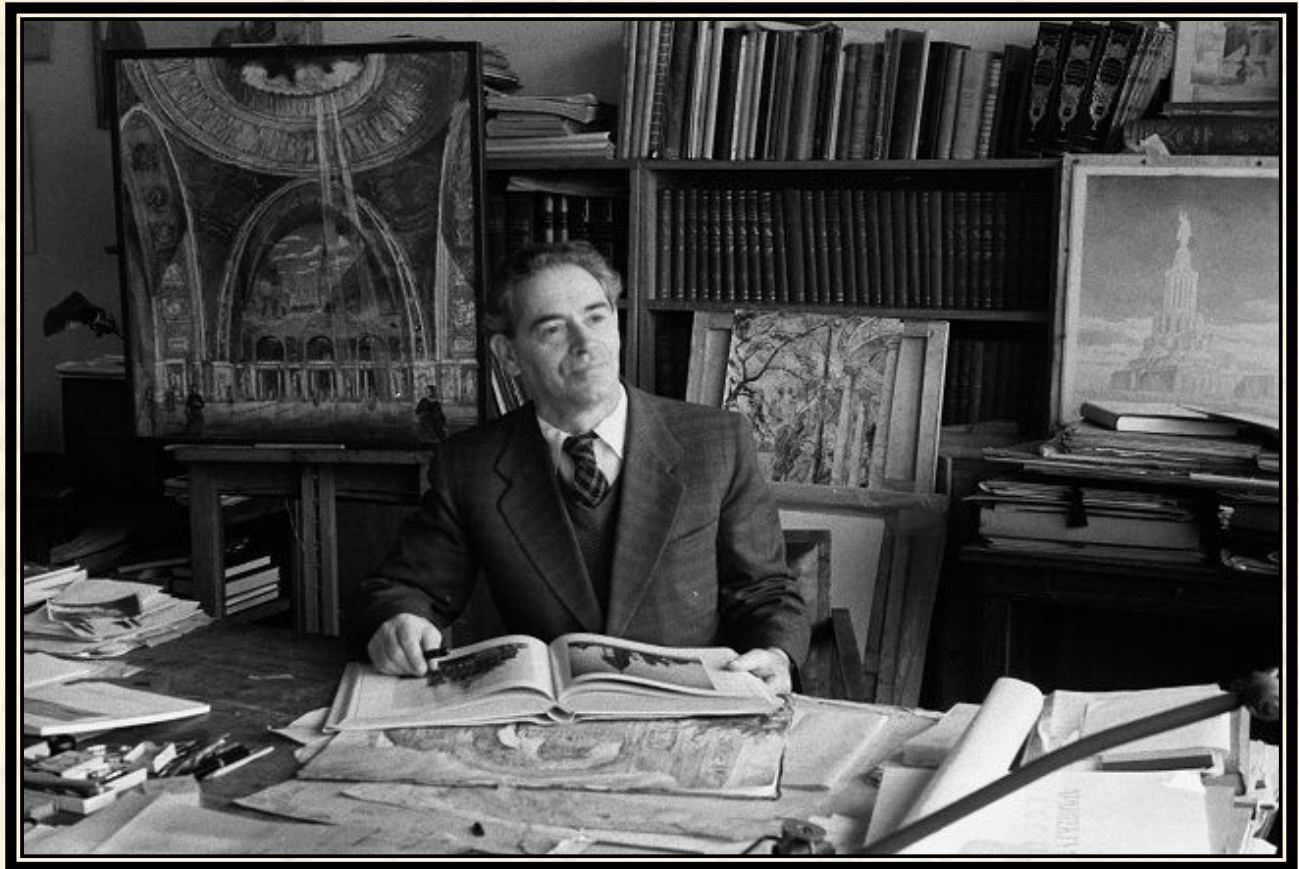
Борис Михайлович Иофан - архитектор

И тогда на защиту Москвы встал целый батальон архитекторов и художников, которые за считанные дни нарисовали на месте Москвы совсем новый город.