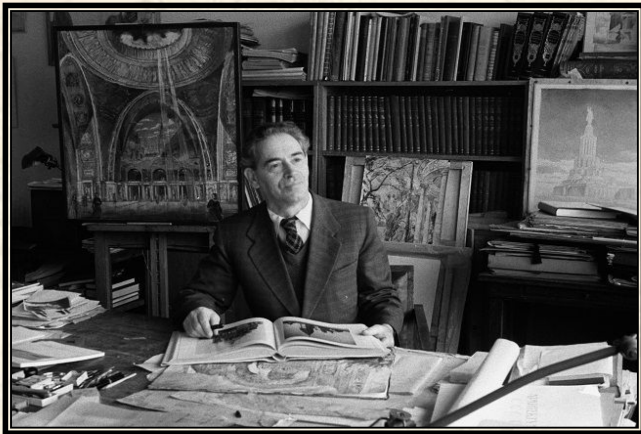
Борис Михайлович Иофан - архитектор

И тогда на защиту Москвы встал целый батальон архитекторов и художников, которые за считанные дни нарисовали на месте Москвы совсем новый город.