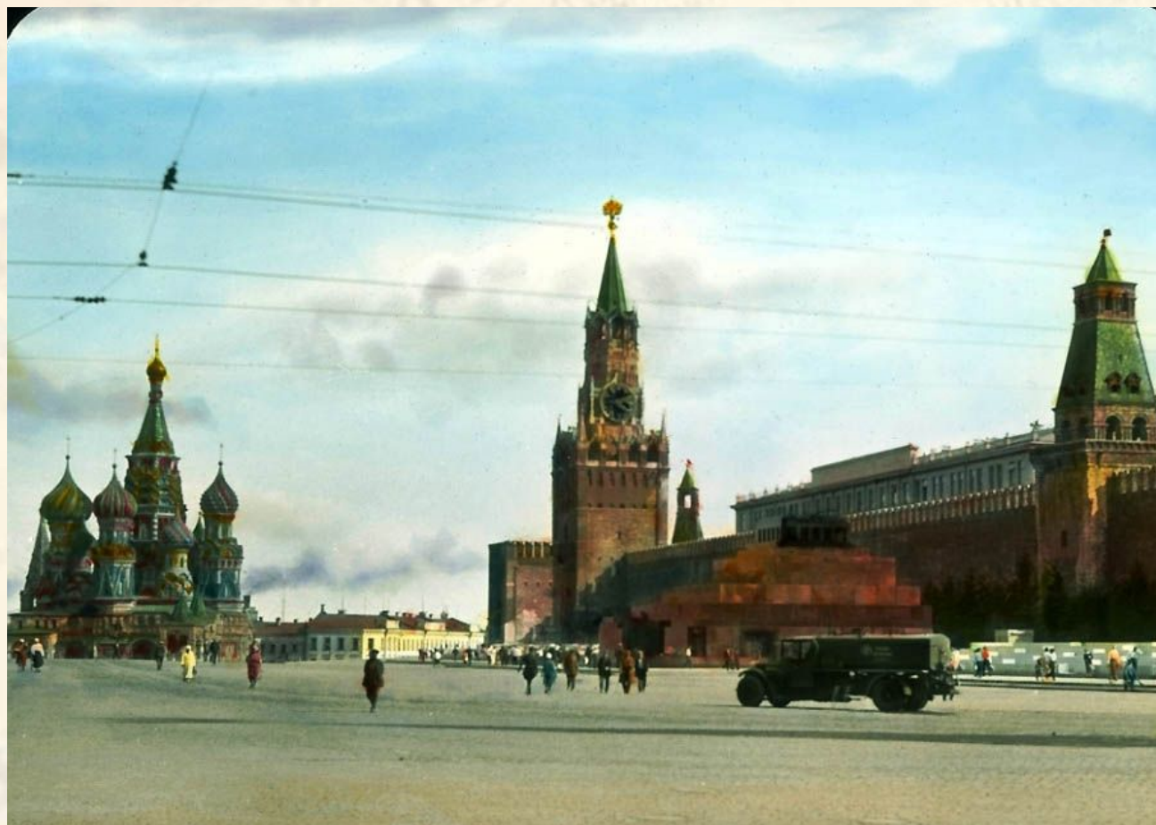
Москва 1931 г.

Основная цель - маскировка Кремля и его окрестностей, важных стратегических объектов, чтобы сбить немцев с толку, свести возможные разрушения к минимуму.