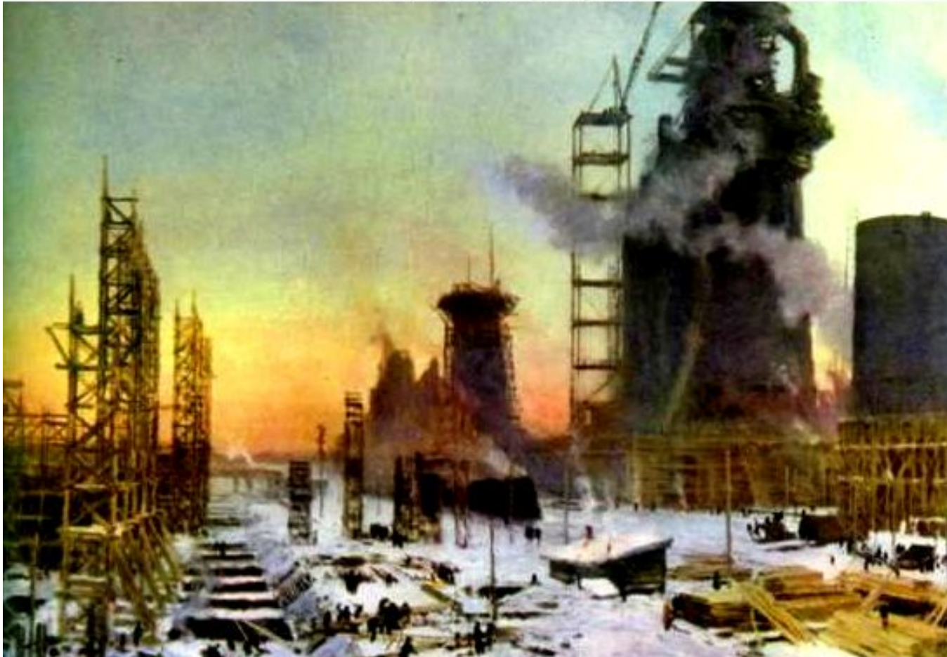
«Утро пятилетки». Художник Я. Д. Ромас. Строительство Магнитогорского металлургического комбината.