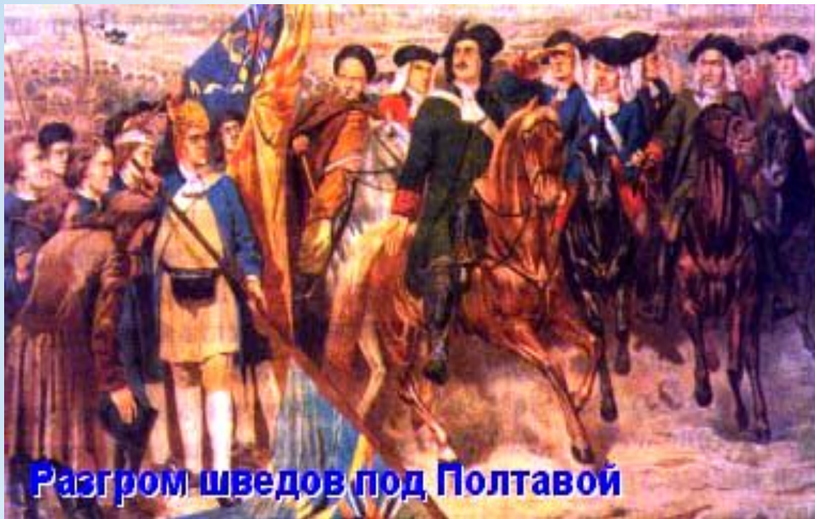
Разгром шведов под Полтавой