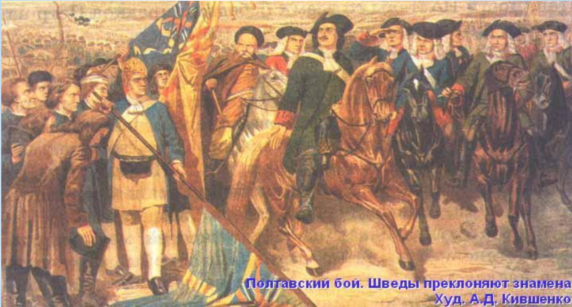
Полтавский бой. Шведы преклоняют знамена Худ. А.Д. Кившенко

Победа под Полтавой предопределила победоносный для России исход Северной войны 1700-1721гг. и поставила Россию в ряд великих европейских держав.