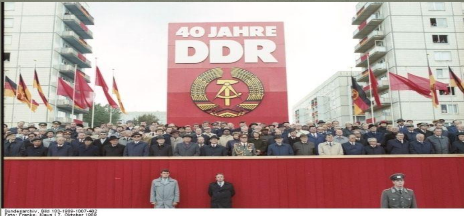
7. Oktober 1989

Германская Демократическая Республика (ГДР, Восточная Германия) — социалистическое государство, основанное 7 октября 1949 года в советской оккупационной зоне Германии и восточном (советском) секторе Берлина.