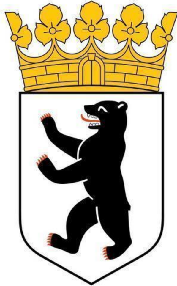
Герб города Берлина – столицы Германии