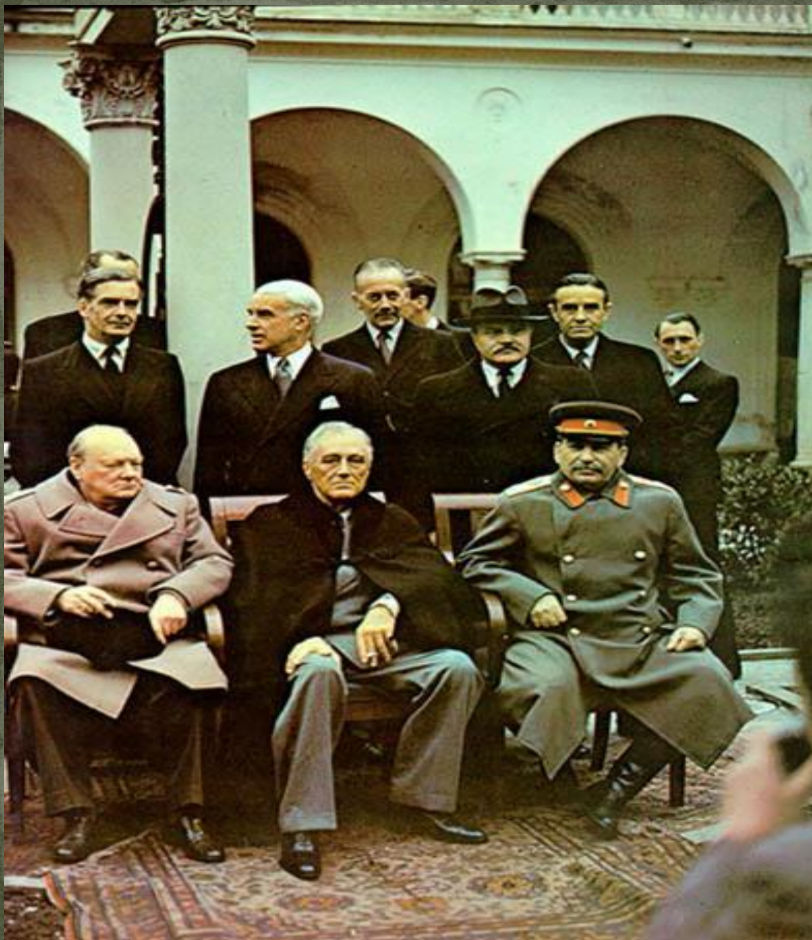
На Крымской (Ялтинской) Конференции 1945 г. лидеры стран- победительниц: Ф. Рузвельт, У. Черчилль, И.В. Сталин.