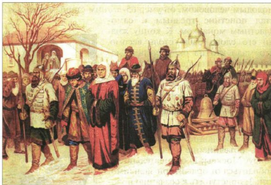
Присоединение Великого Новгорода — высылка в Москву знатных и именитых новгородцев. Художник А. Д. Кившенко