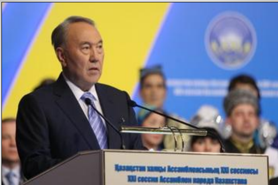
Председатель Ассамблеи Н.А.Назарбаев