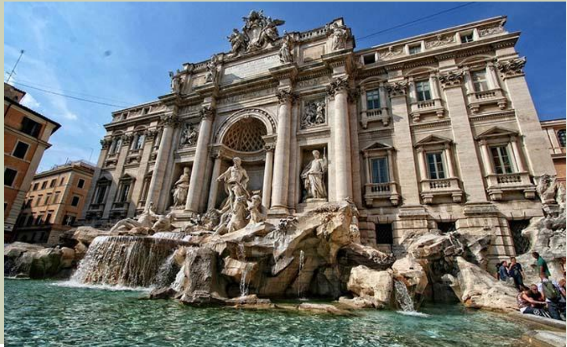
Фантан Трэві (Рым)