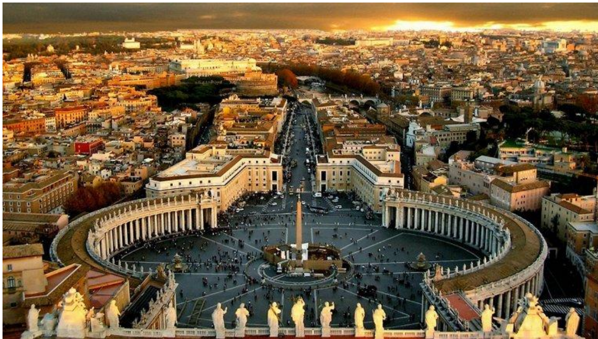
Площа Святого Петра (Рым)