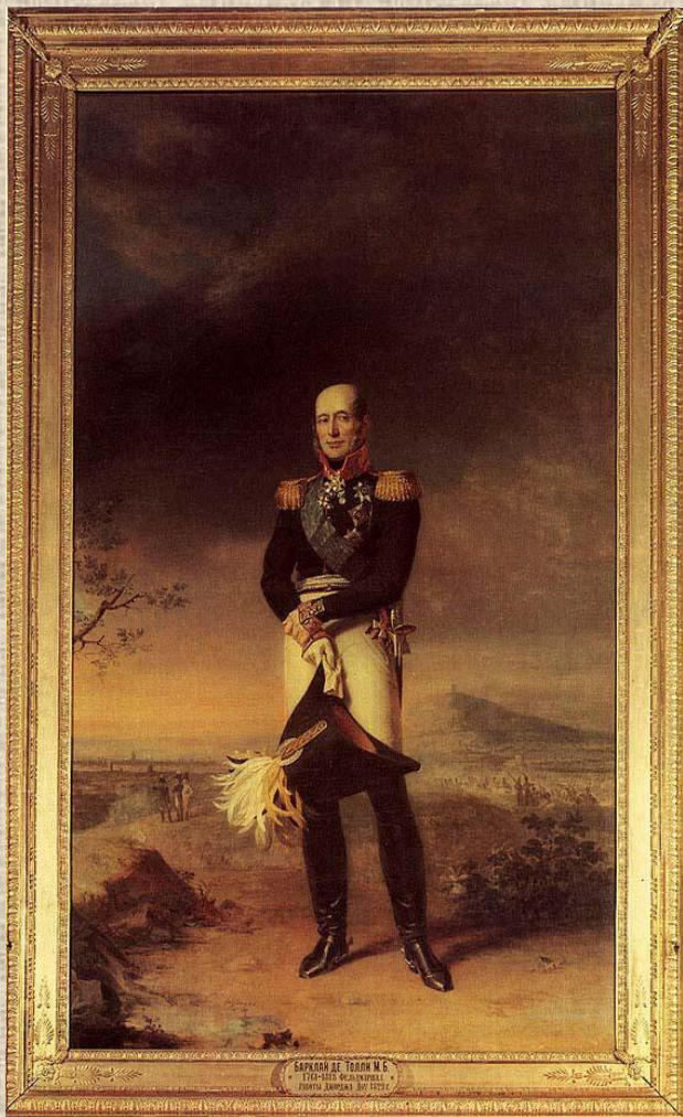
Дж.Доу Портрет М.Б.Баркляя-де-Толли 1829 (Государственный Эрмитаж, Санкт-Петербург, галерея 1812-го года)

С тех пор прошло более полутора столетий. Все дальше и дальше уходят в прошлое героические дни Отечественной войны 1812 года. Лишь архивы и специальная литература могут рассказать о перипетиях, связанных с историей создания Военной галереи Зимнего дворца. Но остались портреты, живые лица героев давно минувшей войны, вечная память о подвиге и беззаветном служении.