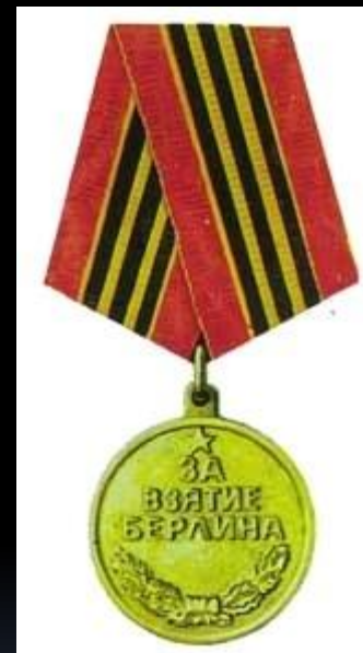
Медаль «За взятие Берлина»