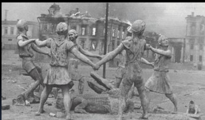
Чудом уцелевший после авианалёта 23 августа фонтан «Дети и крокодил»

Сражение включало в себя попытку вермахта захватить левобережье Волги в районе Сталинграда (современный Волгоград) и сам город, противостояние в городе, и контрнаступление Красной армии (операция «Уран»), в результате которого 6-я армия вермахта и другие силы союзников Германии внутри и вокруг города были окружены и частью уничтожены, частью захвачены в плен.