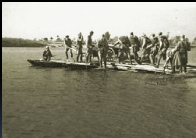
Советские бойцы форсируют Днепр

В результате четырёхмесячной операции левый берег Днепра был освобождён Красной Армией от немецких захватчиков. В ходе операции значительные силы Красной Армии форсировали реку, создали несколько плацдармов на правом берегу реки, а также освободили город Киев.