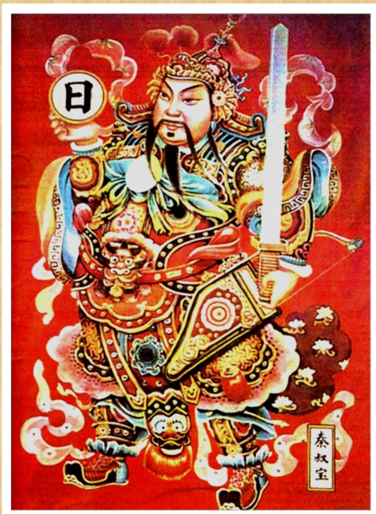
Цинь Шихуань Жібекке салынған ежелгіқытай суреті