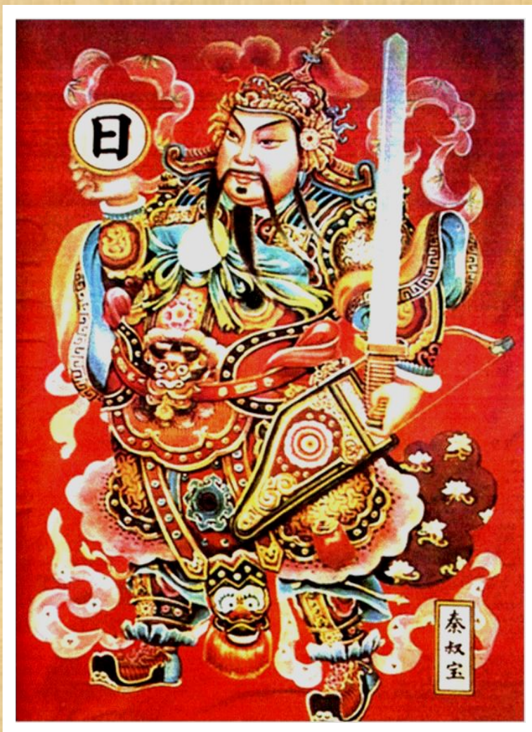
Цинь Шихуань Жібекке салынған ежелгіқытай суреті