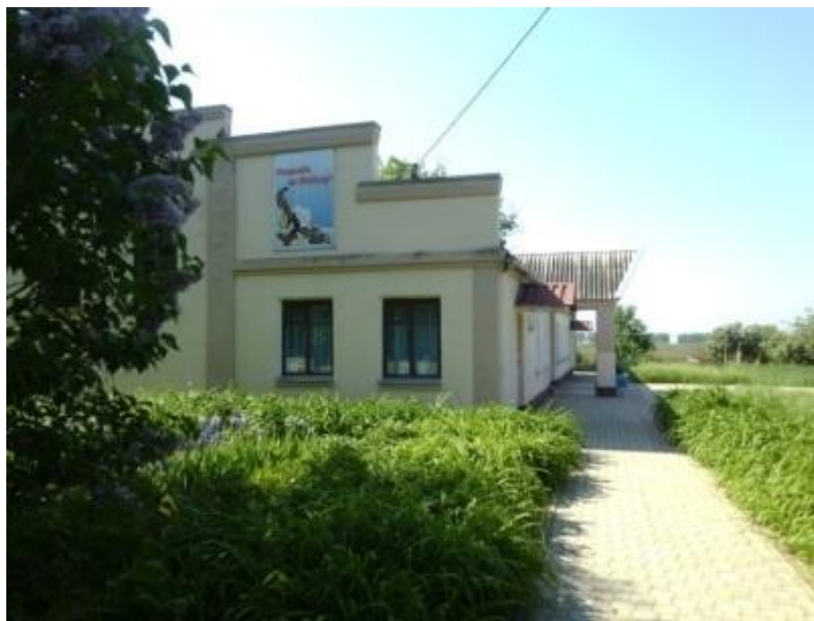
Нынешнее здание клуба посёлка Степного

В те годы IV-е отделение состояло из 2-х частей - «Нового» и «Старого» отделений (так они назывались в обиходе). «Новое отделение» - это территория ныне существующего посёлка. Оно состояло из 5-ти жилых домов, так называемых «бараков» (четыре из них существуют и по-ныне), а так - же здание нынешнего клуба (оно выполняло функцию складского помещения).