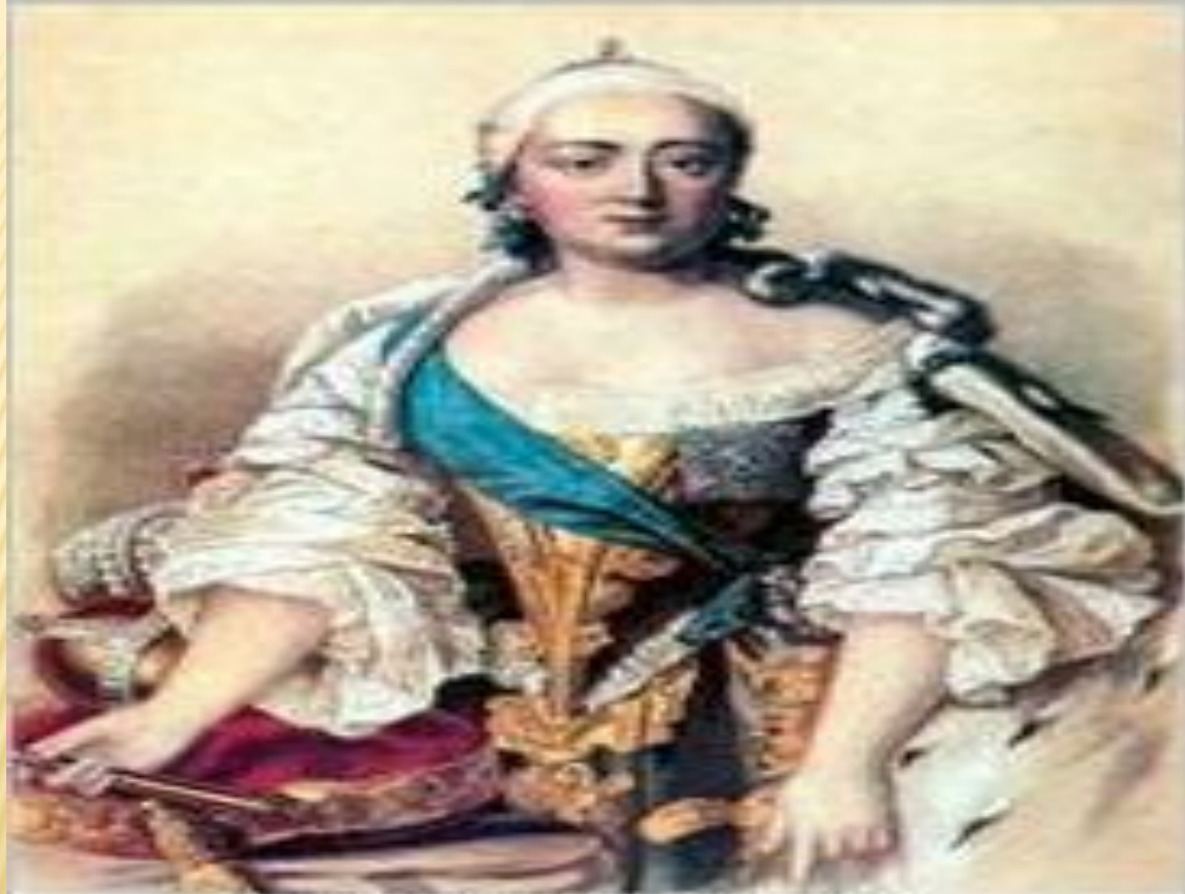
Елизавета Петровна (1709-1761)