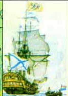
Военный корабль. XVIII век