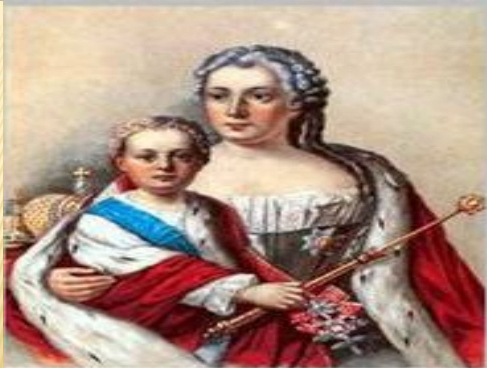
Иоанн VI Антонович (1740-1764)