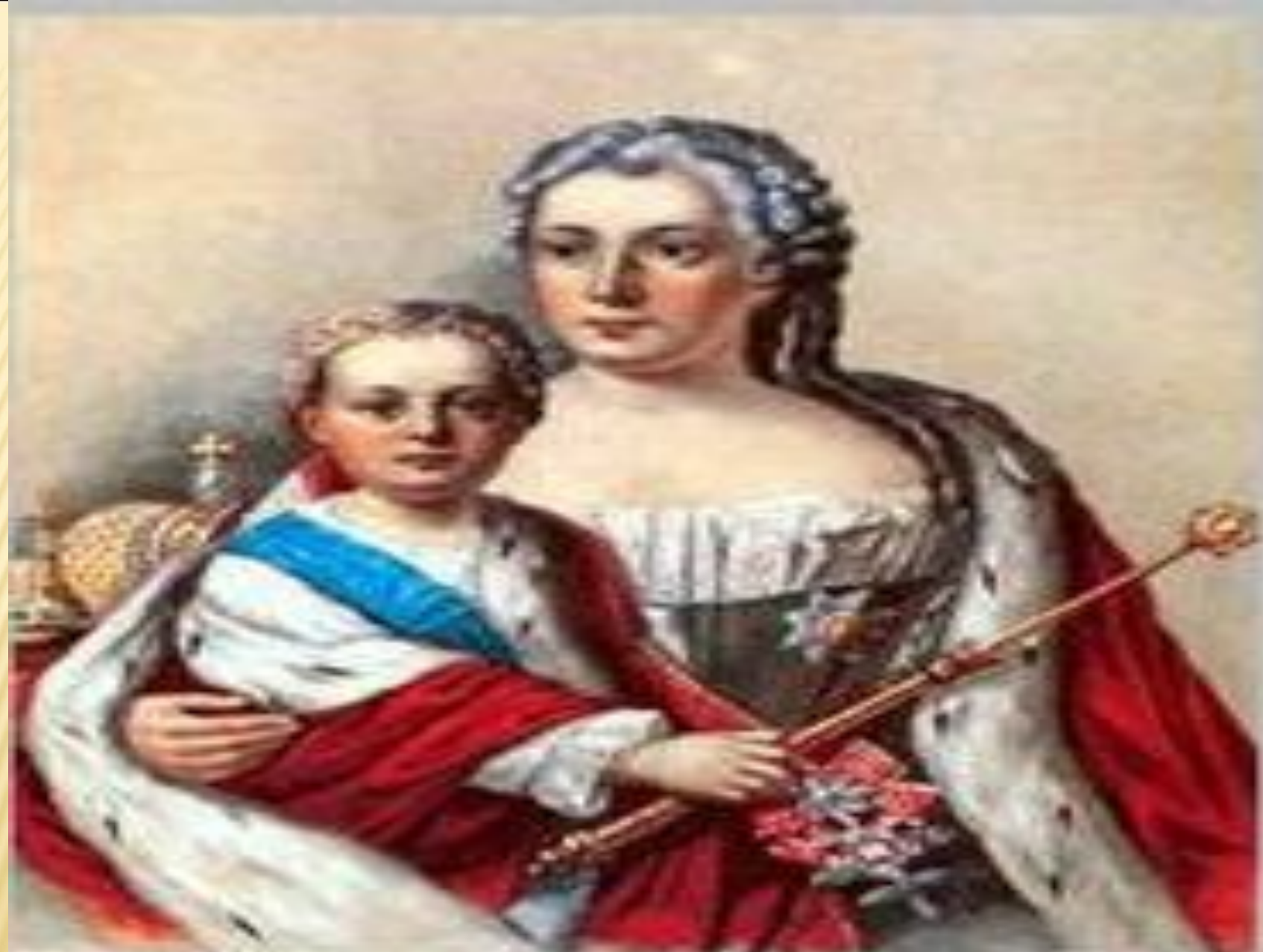
Иоанн VI Антонович (1740-1764)