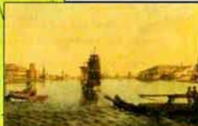
Петербург начала XVIII в. Худ. Е. Лансере

Территория России к 1695 г. Азовские походы русских войск в 1695-1696 гг. Территория, присоединенная к России в результате Азовских походов и возвращенная Турцией по Прутскому миру 1711 г. Территории, вошедшие в состав России с 1721 г. по 1763 г.