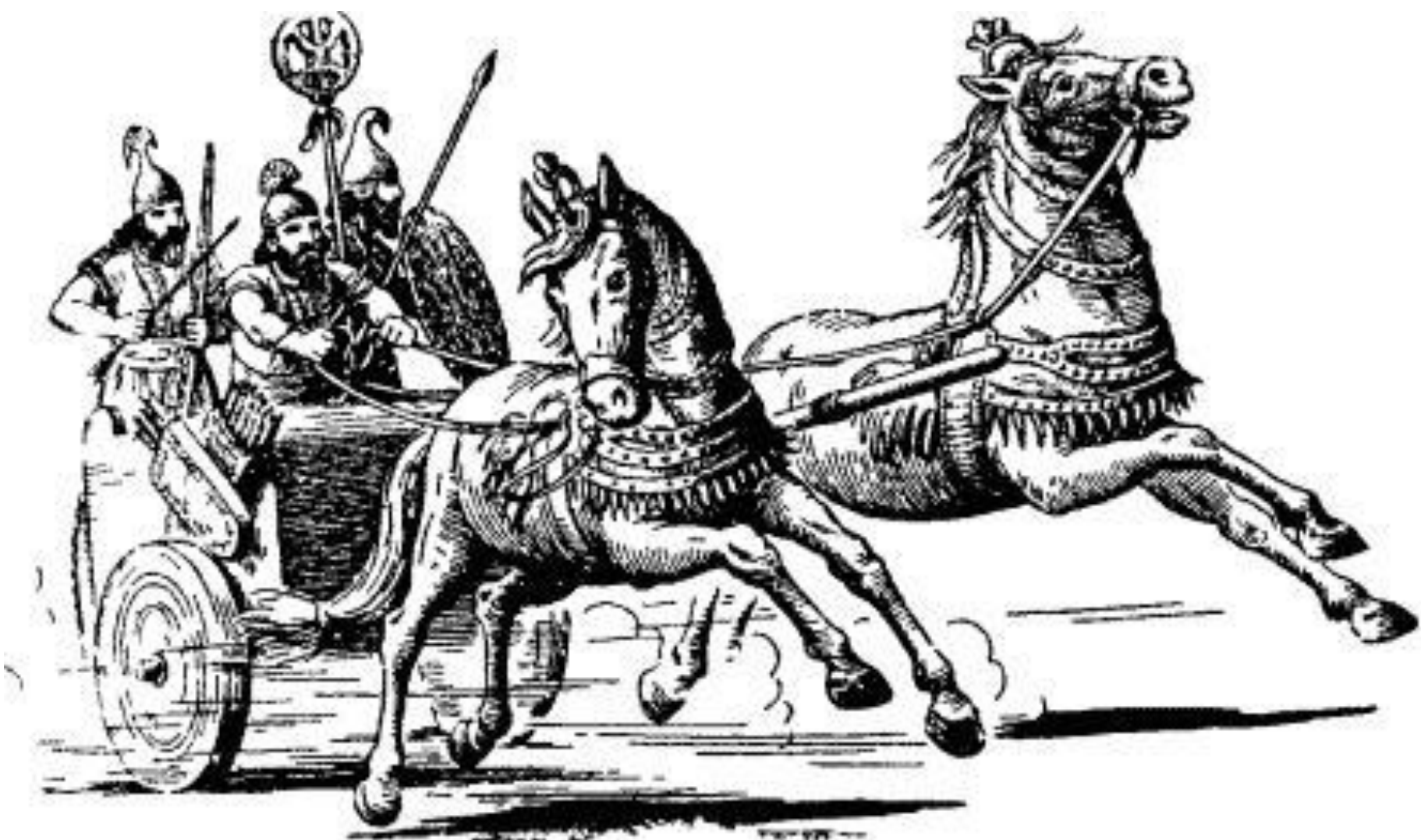
Ассирийская боевая колесница