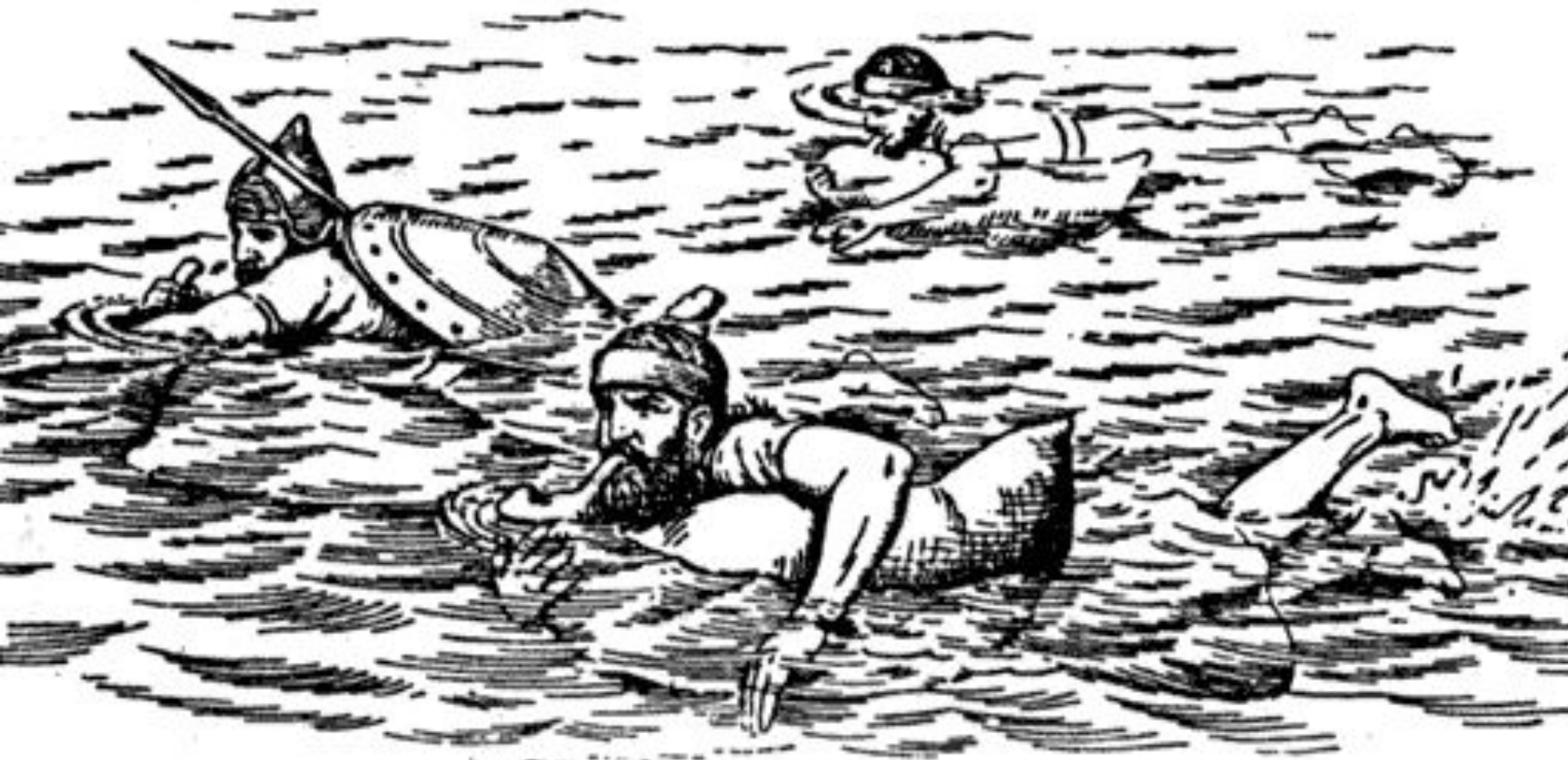
Переправа ассирийской пехоты через реку