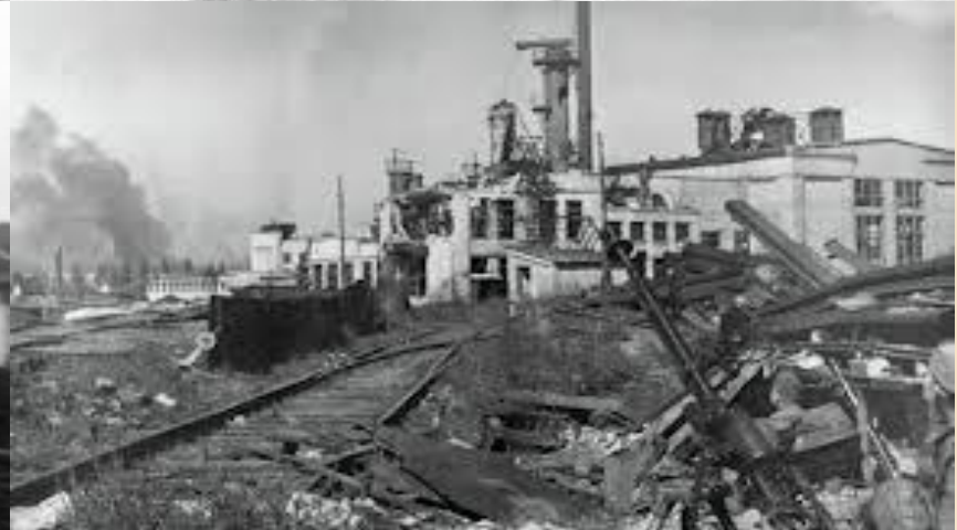
2) контрнаступление советских войск (с 19 ноября по 2 февраля 1943 года).