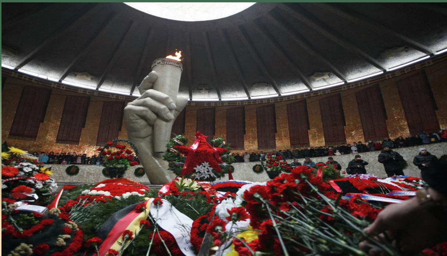
Памятник-ансамбль «Героям Сталинградской битвы»