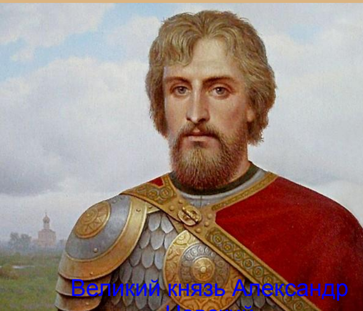
Великий князь Александр Невский