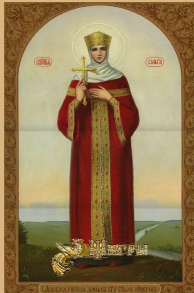
Святая княгиня Ольга