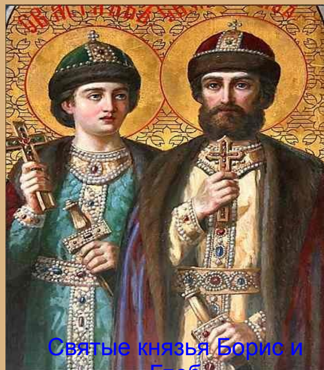
Святые князья Борис и Глеб