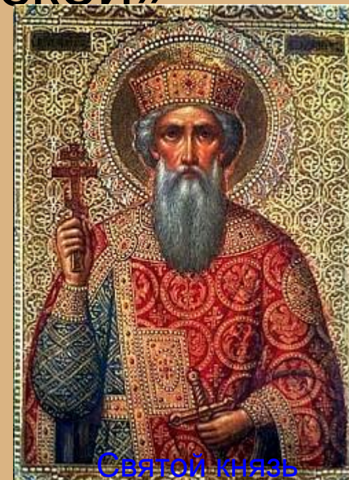
Святой князь Владимир