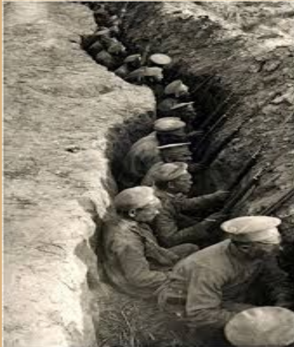
Российские солдаты в окопах во время I Мировой войны (1 августа 1914 г.)