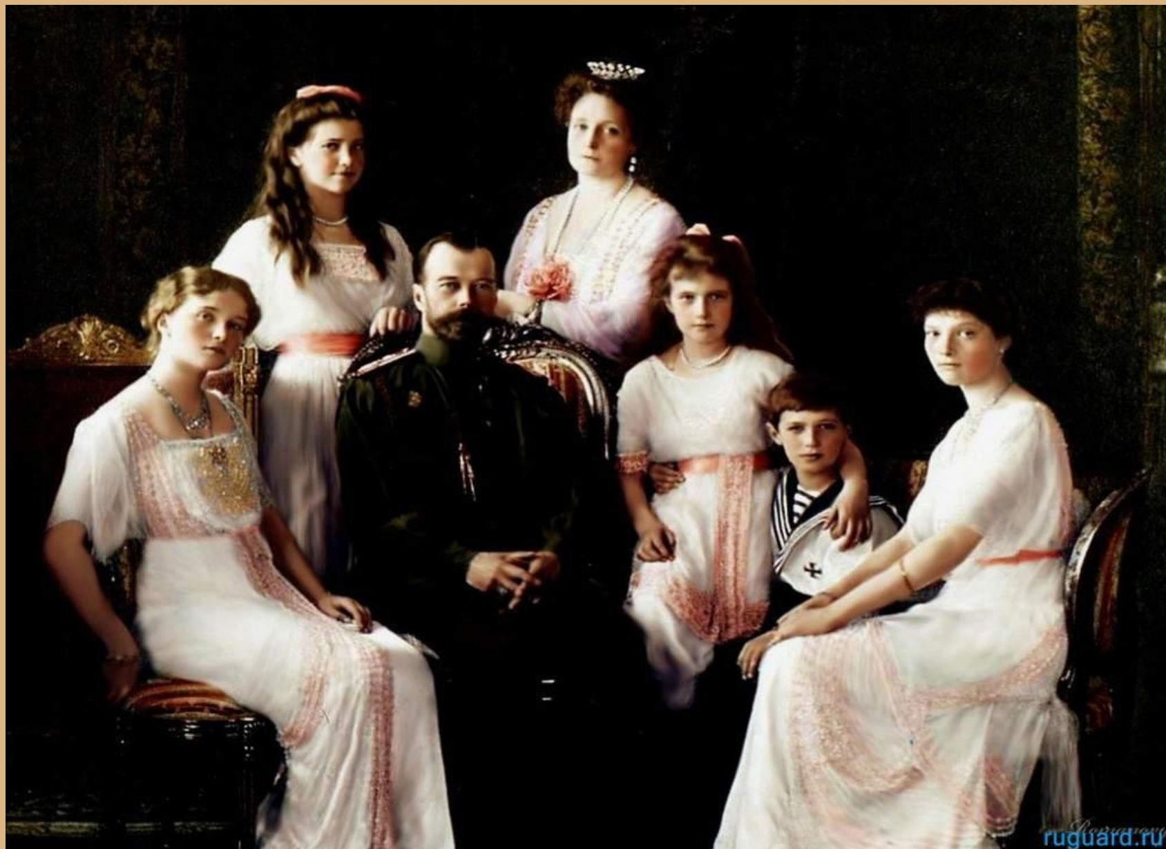
Император Николай II с семьёй