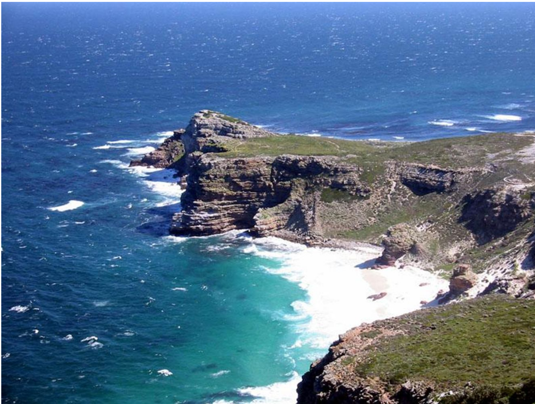
Мыс Доброй надежды – южная оконечность Африки