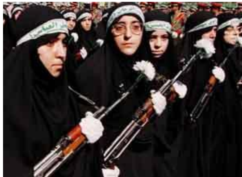
Иран: природа и люди