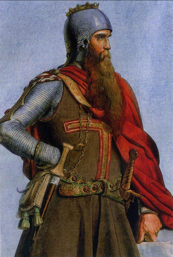
Фридрих Барбаросса 1152 - 1190

Попытки императоров (Фридрих Барбаросса и его внук Фридрих II) подчинить себе Италию не удались.