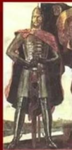
А. Невский худ. П. Корин