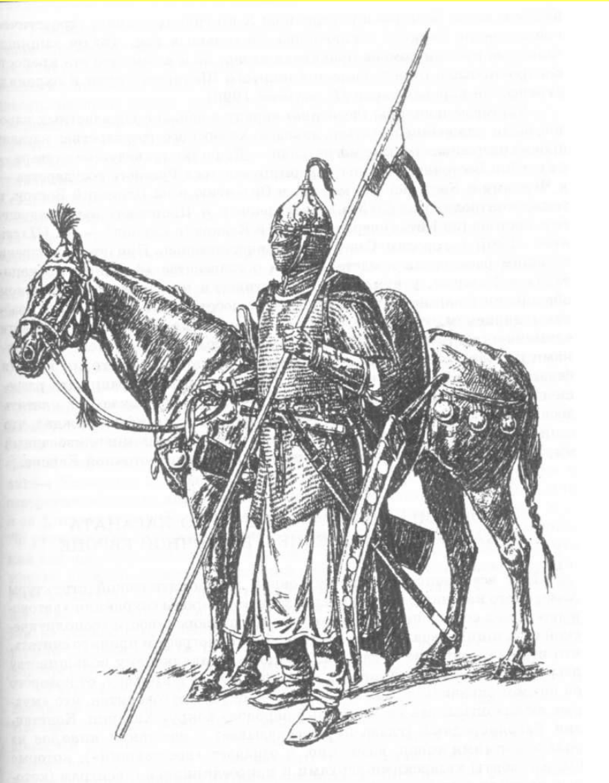
Тяжеловооруженный хазарский воин