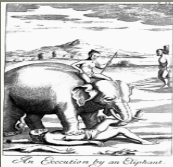
An Execution by an Elephant.