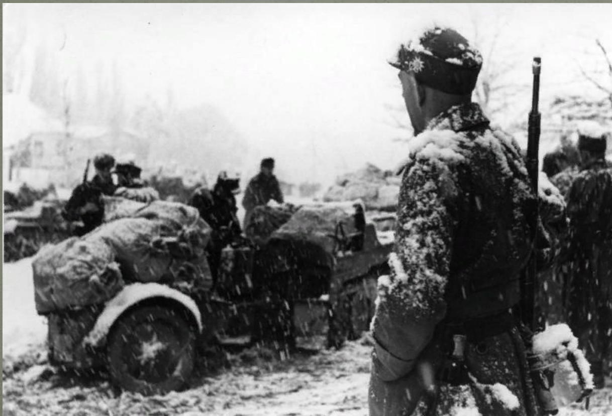
Немецкие мотострелковые войска в снегу под Орджоникидзе

Нальчикско-Орджоникидзевская операция (Владикавказская операция) — оборонительная операция Северной группы войск Закавказского фронта в Великой Отечественной войне, проведённая в ходе битвы за Кавказ с 25 октября по 12 ноября 1942 года с целью недопущения прорыва немецких и румынских войск через Нальчик и Орджоникидзе к Грозному, Тбилиси и Баку (Грозненскому и Бакинскому нефтеносным районам и в Закавказье).