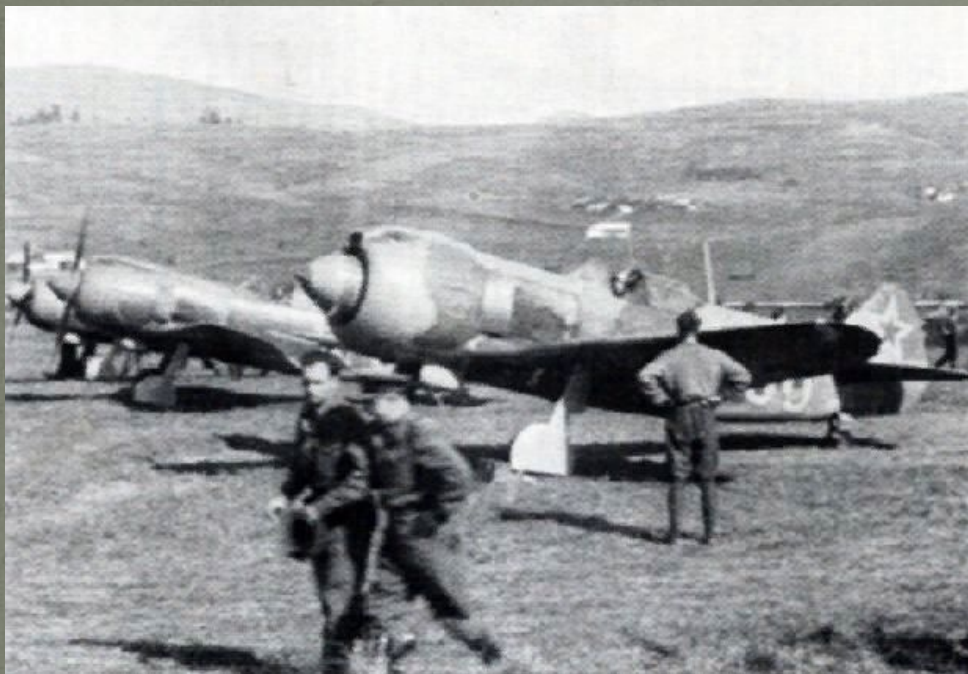
Советские истребители Ла-5 на полевом аэродроме

Воздушные сражения на Кубани — серия крупномасштабных сражений советской авиации с немецкой авиацией в апреле — июне 1943 года над низовьями р. Кубань, Таманским полуостровом и Новороссийском в Великой Отечественной войне, с целью захвата стратегического господства в воздухе, над плацдармом немецких войск на Кубани.