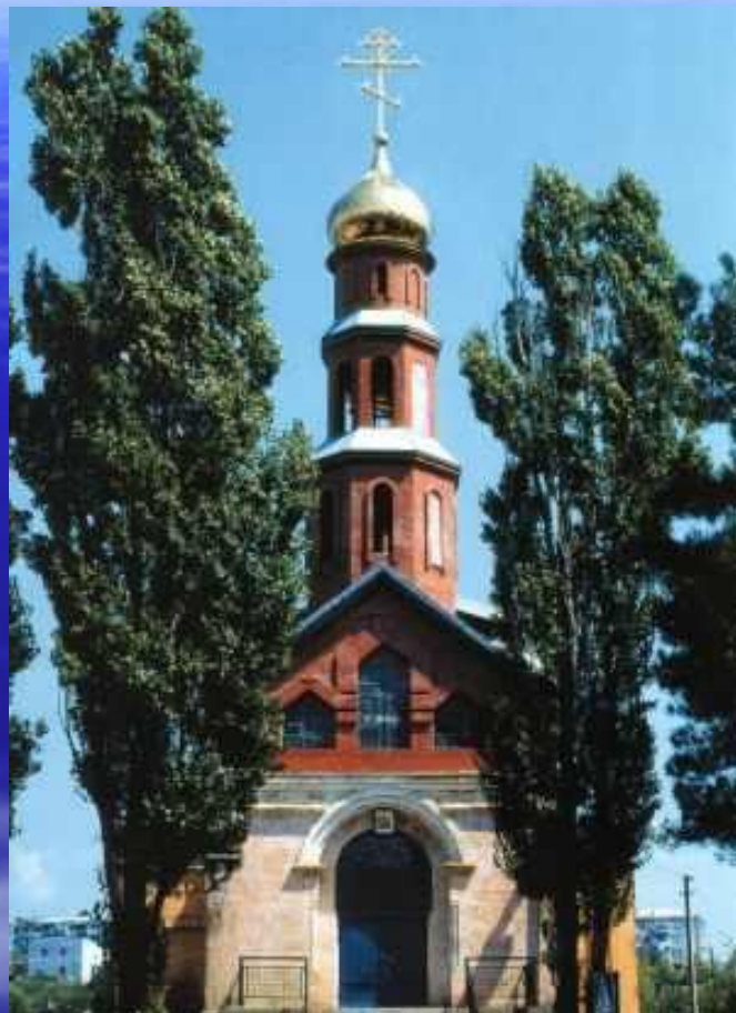
Свято-Никольский храм п.Архипо-Осиповка