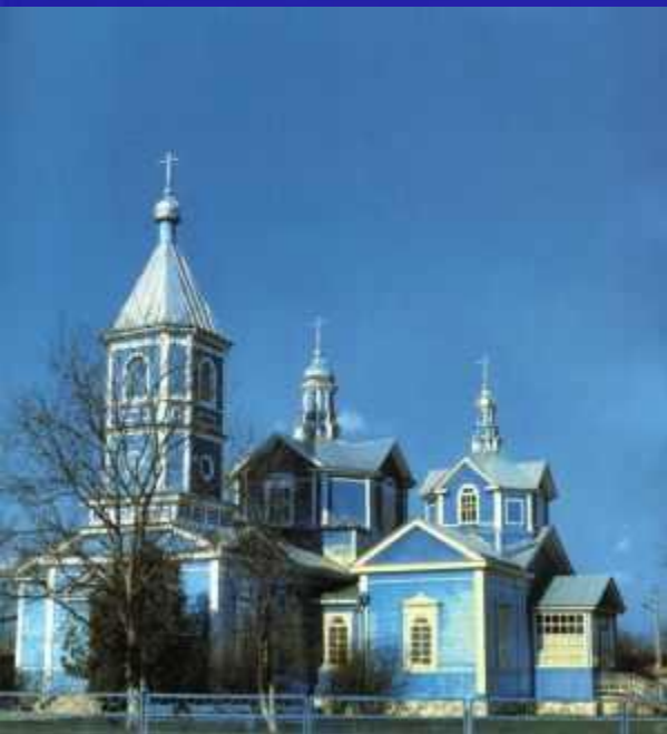
Свято-Богоявленский храм ст.Калининская