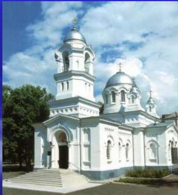
Спасо-Вознесенский храм г. Геленджик