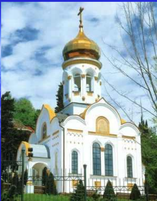
Свято-Никольский храм п.Лазаревский