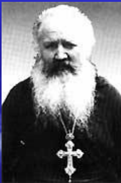
Архимандрит Никон (Мозговой)