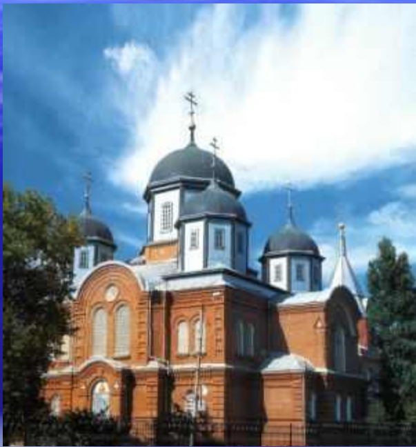
Свято-Покровский храм г. Кропоткин