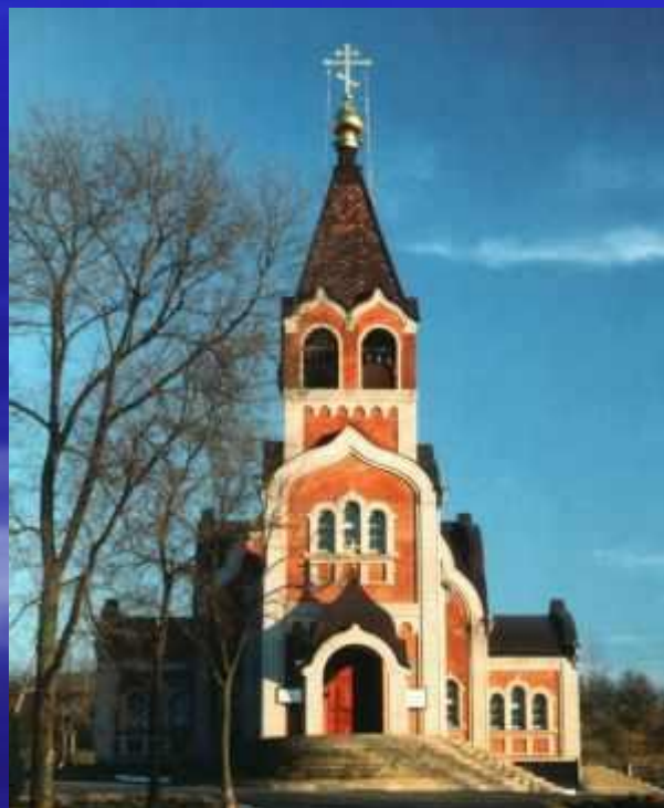
Михаило-Архангельский храм г.Темрюк