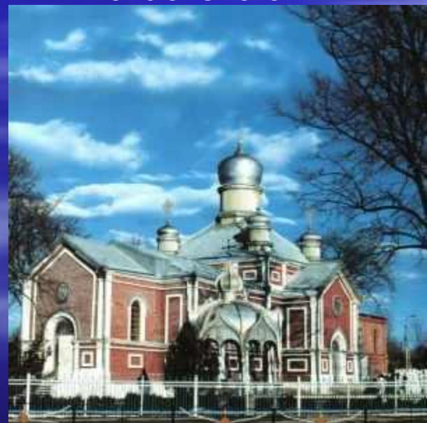
Свято-Троицкий собор г. Майкоп