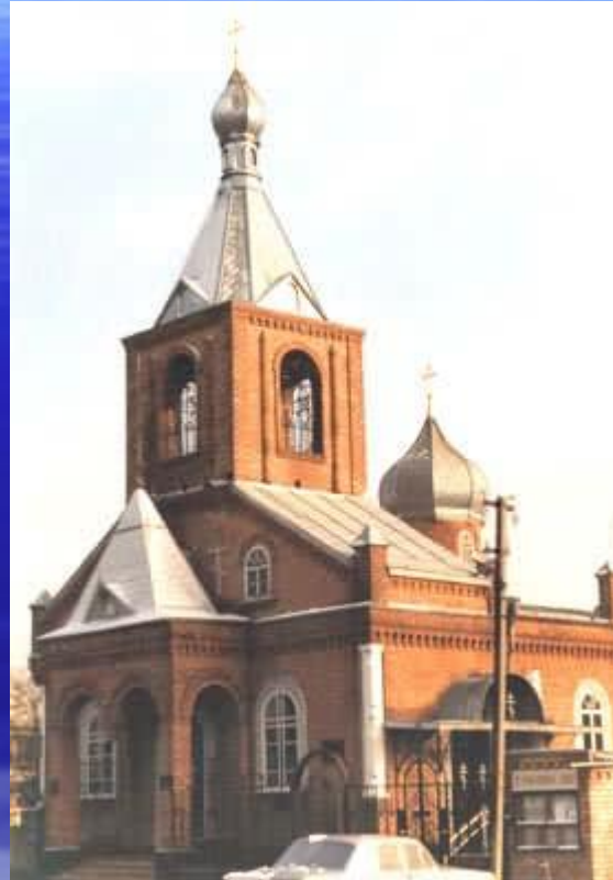
Динской Свято-Троицкий храм