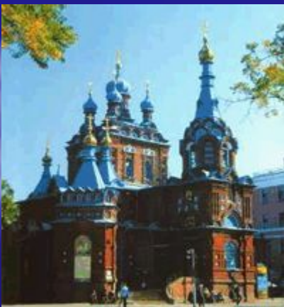
Свято-Георгиевский храм г. Краснодар