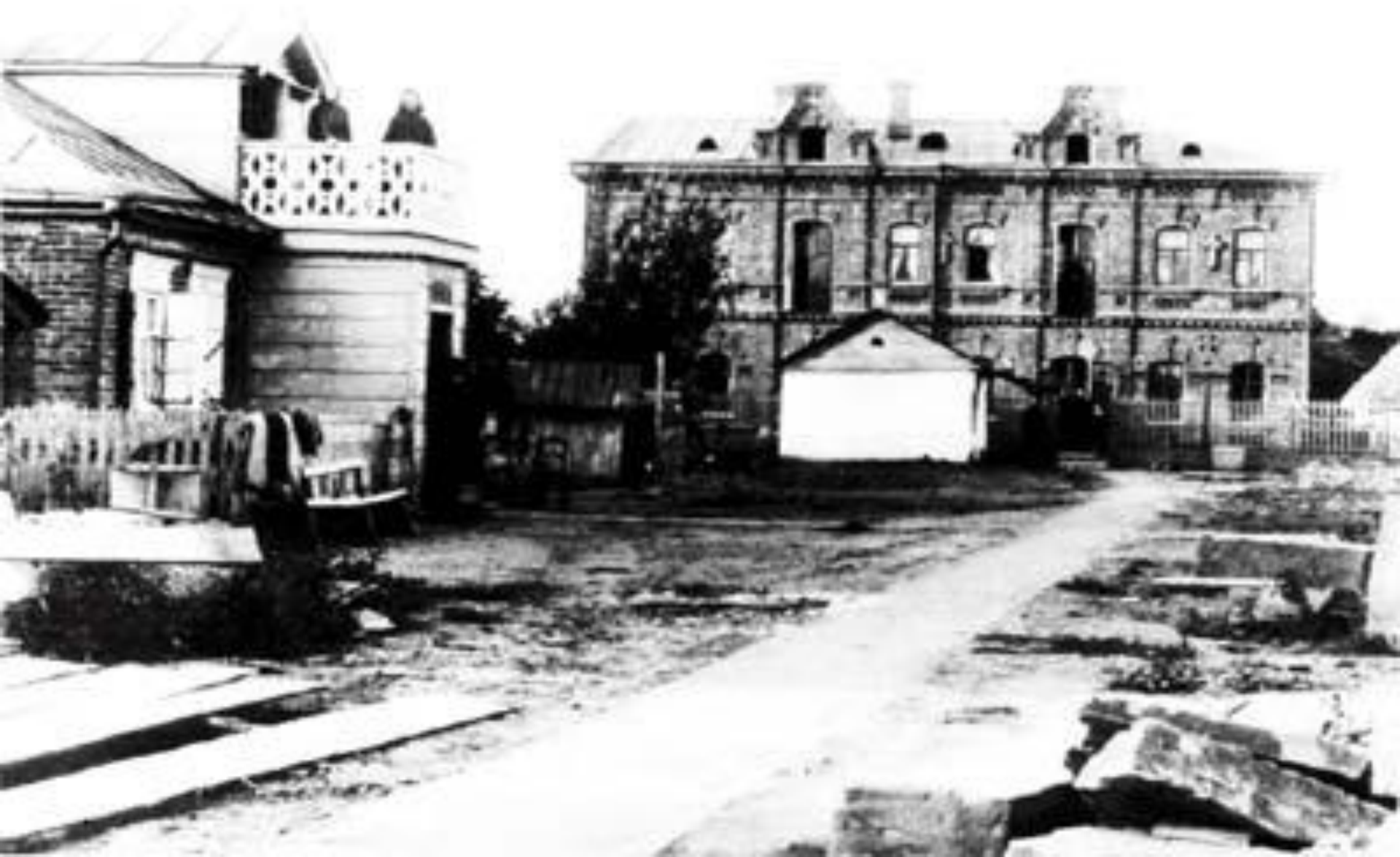
Южная часть монастырского подворья периода начала строительства Храма (архивное фото).