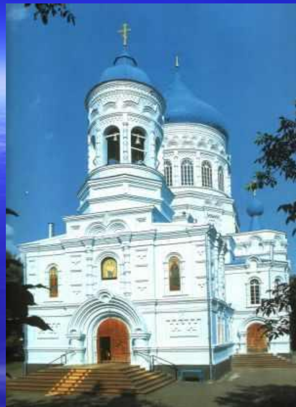
Свято-Покровский храм ст.Каневская