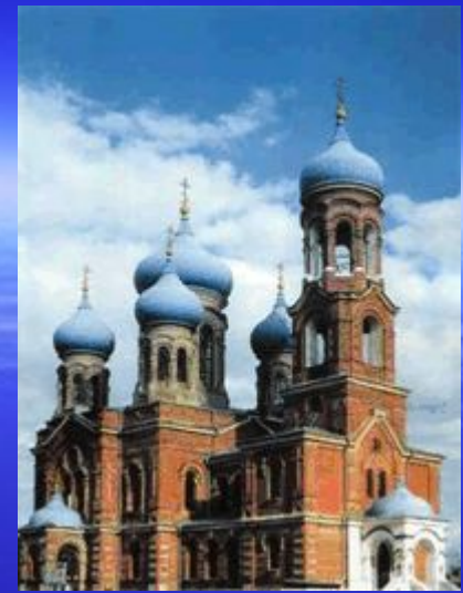
Рождество-Богородицкий храм ст.Воронежская