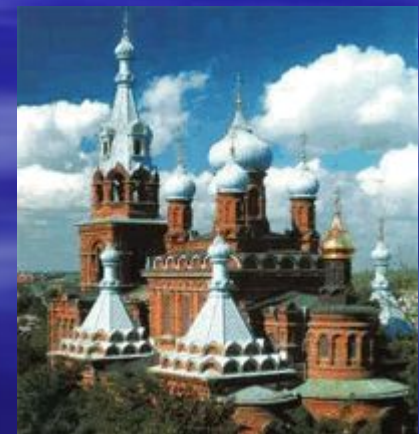
Свято-Троицкий собор г. Краснодар