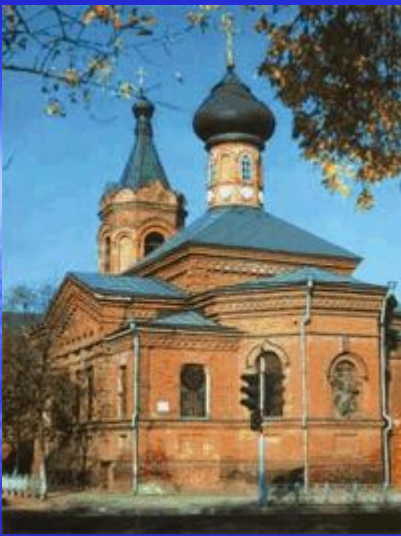
Церковь св. Ильи Пророка г. Краснодар