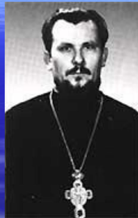
Протоиерей Евгений Околот