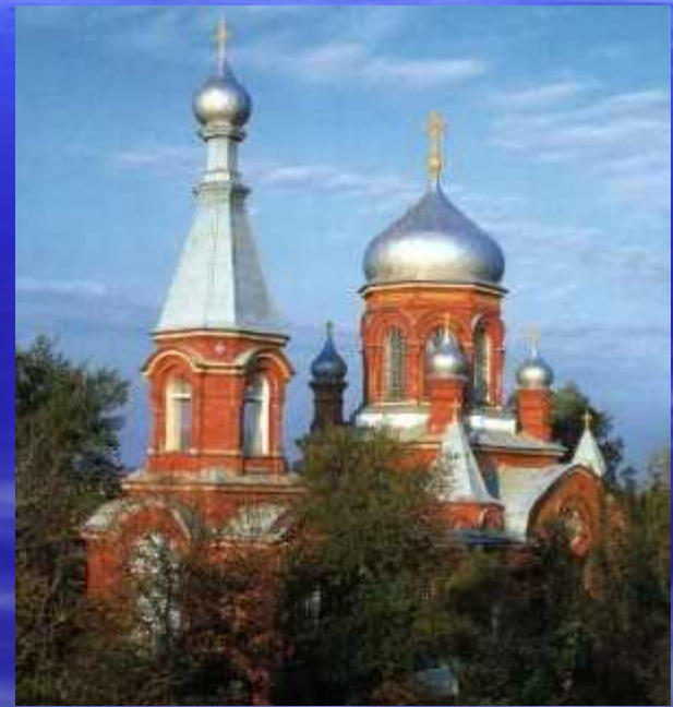
Свято-Троицкий храм ст. Кавказская