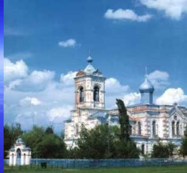
Свято-Успенский храм ст.Успенская