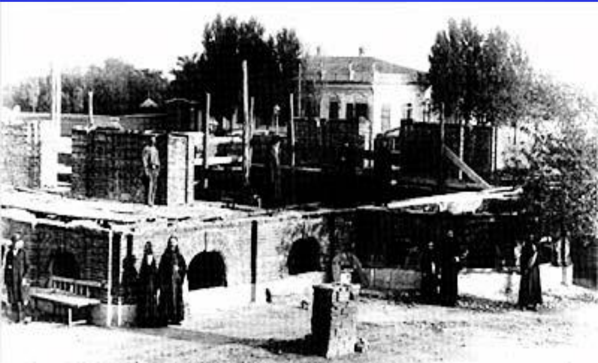
Начало строительства храма (архивное фото)