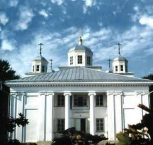
Свято-Никольский храм г. Ейск