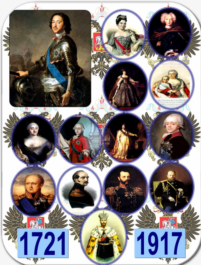
Императоры России (коллаж)

В октябре 1721 года празднества в Петербурге по поводу подписания Ништадского мира знаменовавшего окончание Северной войны завершились торжественной церемонией поднесения царю титула Петра Великого, отца отечества и императора всероссийского. Все девять сенаторов подписали обращение к царю с просьбой принять этот титул.