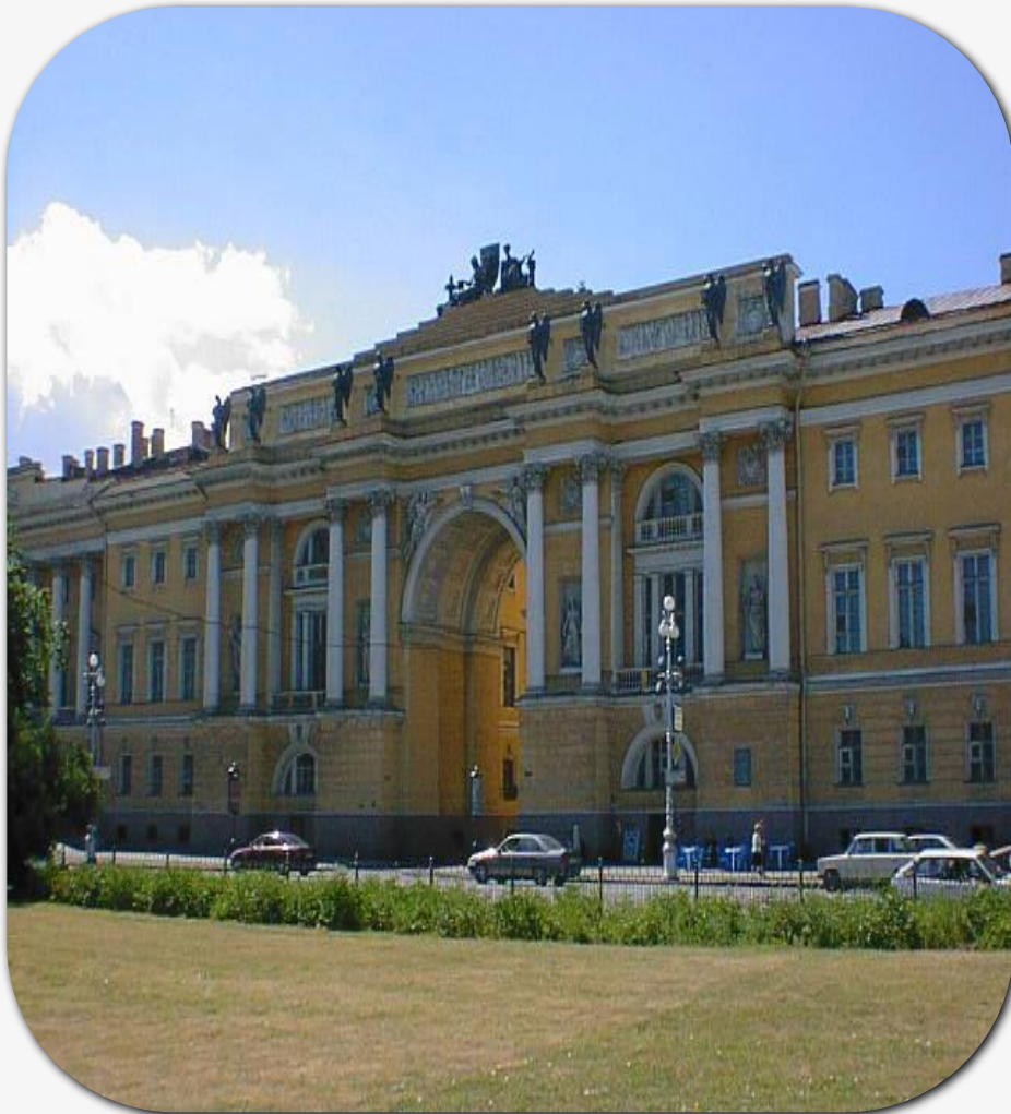
Здание Сената и Синода в С.-Петербурге

Отправляясь в Прутский поход в феврале 1711 г., Петр обнародовал указ: «Определили быть для отлучек наших правительствующих Сенат, для управления...». 2 марта Петр пишет второй указ - с перечнем полномочий (попечение о правосудии, об устройстве государственных доходов, общем управлении, о торговле и хозяйстве). Вскоре Сенат стал высшим судебным и управленческим органом. Поначалу Сенат был коллегиальным органом из 9 сенаторов, обладавших равными голосами. В 1718-1722 гг. Сенат был реформирован. В частности, его членами стали все президенты коллегий. Была введена должность генерал-прокурора.