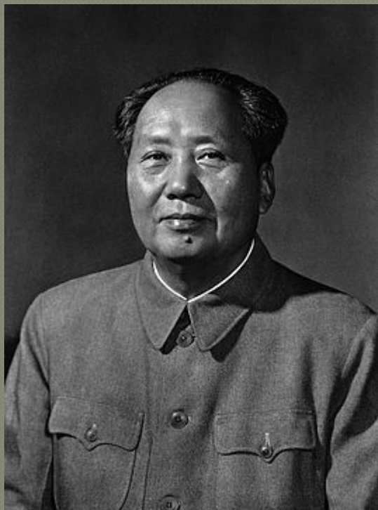
Мао Цзэдун (1893-1976)

Корейская народно-демократическая республика