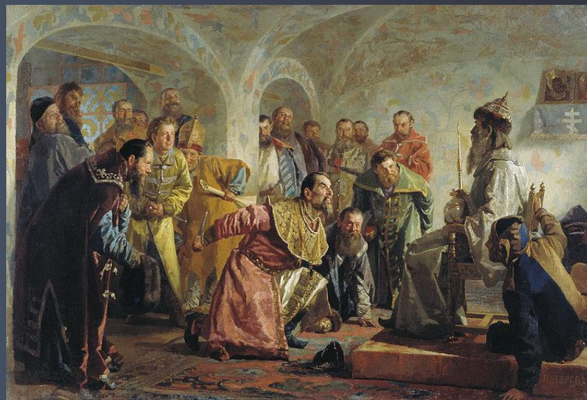
Опричники. Картина В. Неврева