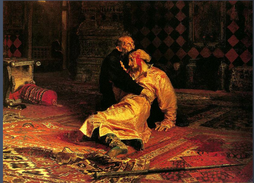
Худ. И. Репин. Иван Грозный и сын его Иван