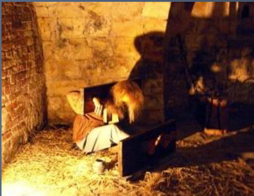
Темница времён Ивана Грозного. Современная реконструкция