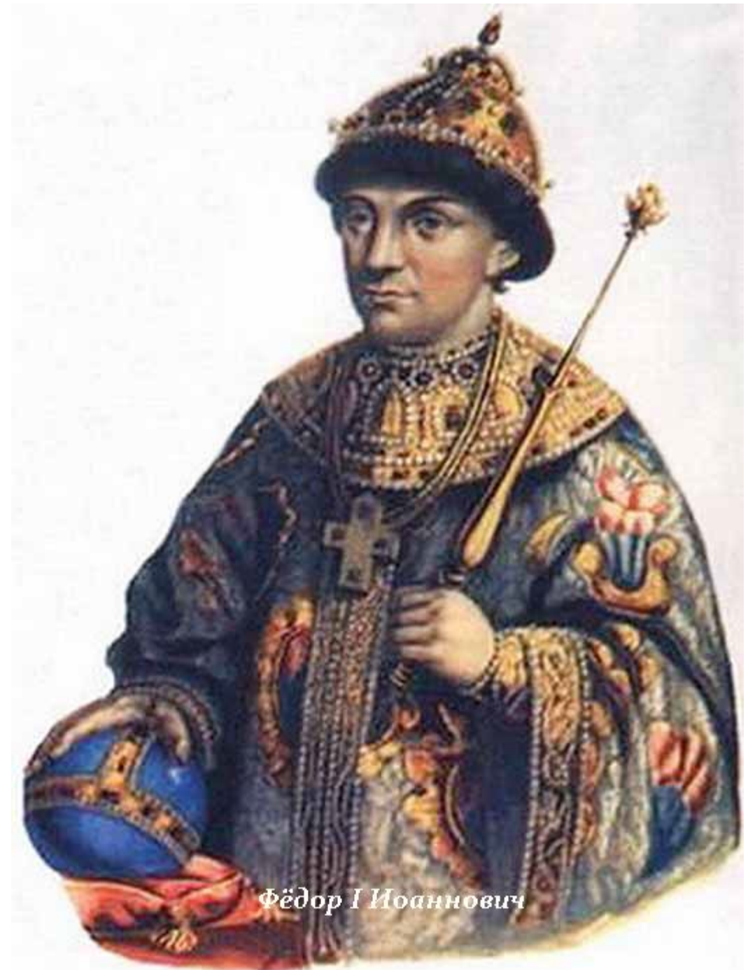
Фёдор I Иоаннович