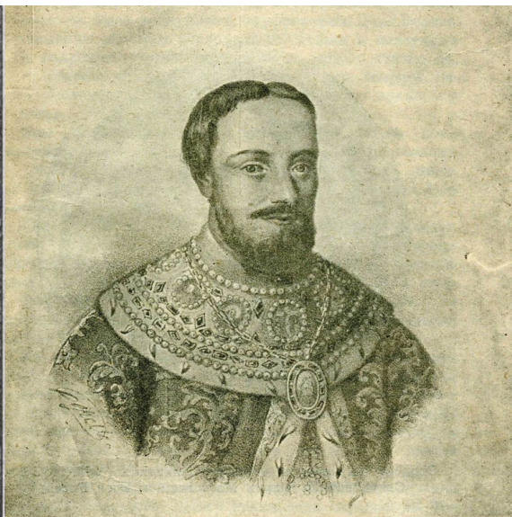
Бояринъ Феодоръ Никитичъ Романовъ Захаринъ-Юрьевъ.