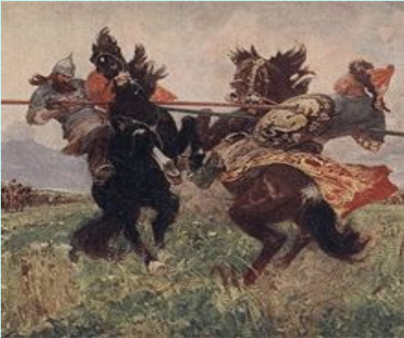
Поединок Пересвета с Челубеем.