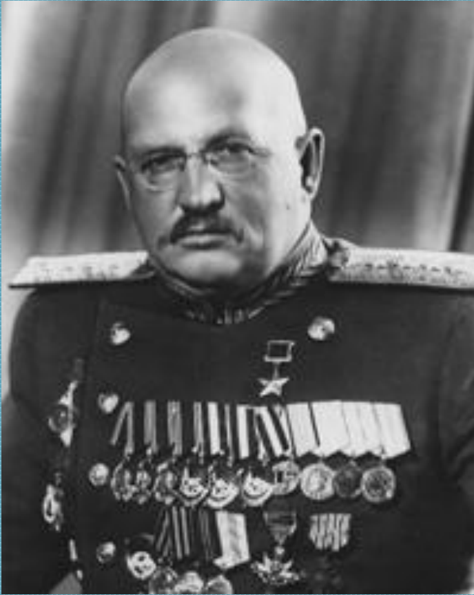
Герой Советского Союза генерал армии И.Е. Петров

«Каждый спортсмен стоит в бою нескольких рядовых бойцов, а взвод спортсменов - надежнее батальона, если предстоит сложная боевая операция» - эти слова произнес Герой Советского Союза генерал армии И.Е. Петров