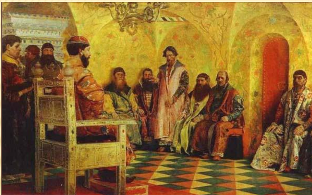
Сидение царя Михаила Фёдоровича с боярами. Картина А. Рябушкина, 1893