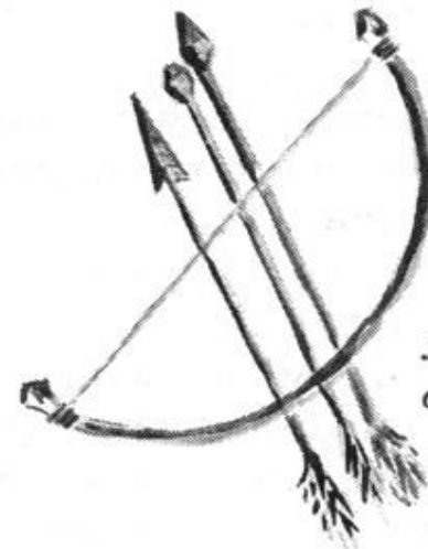
лук и стрелы