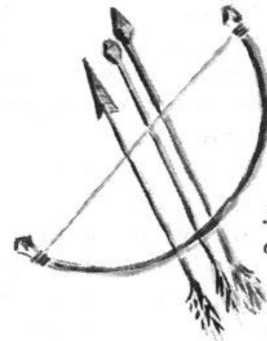
лук и стрелы