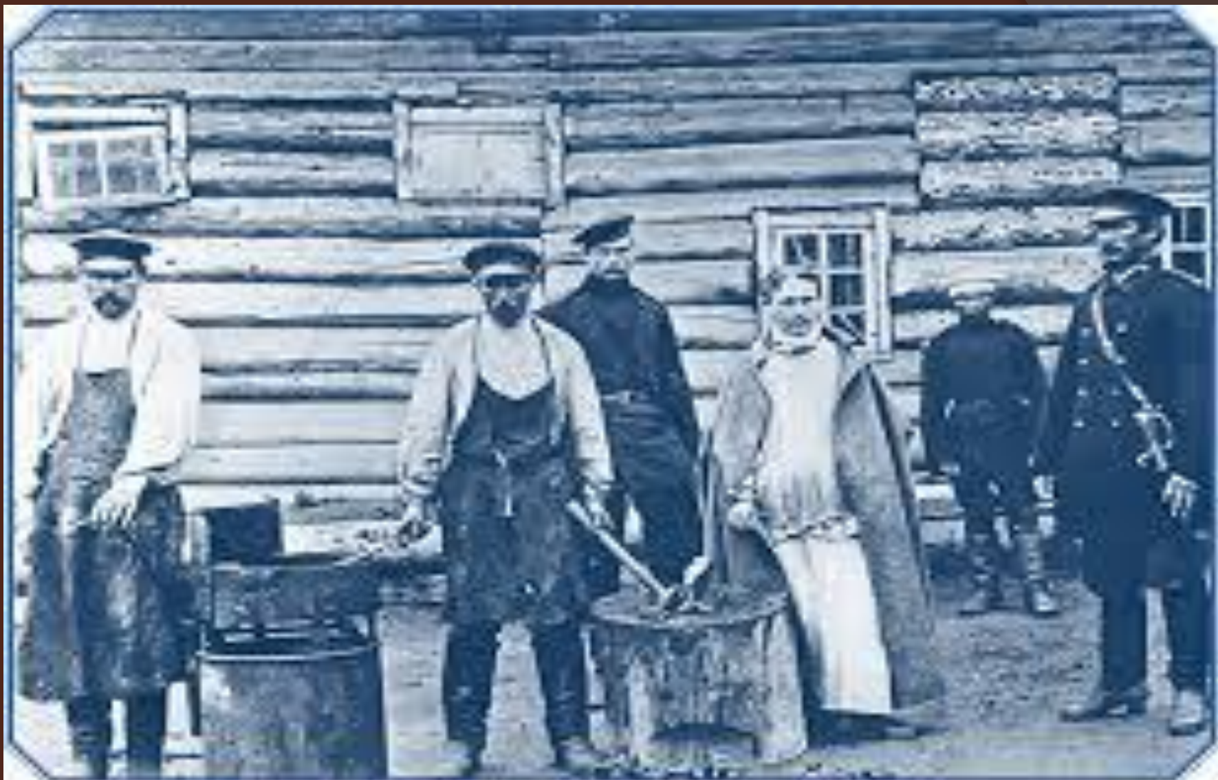
Заковывающие каторжан в кандалы. Фотография. Конец XIX в.