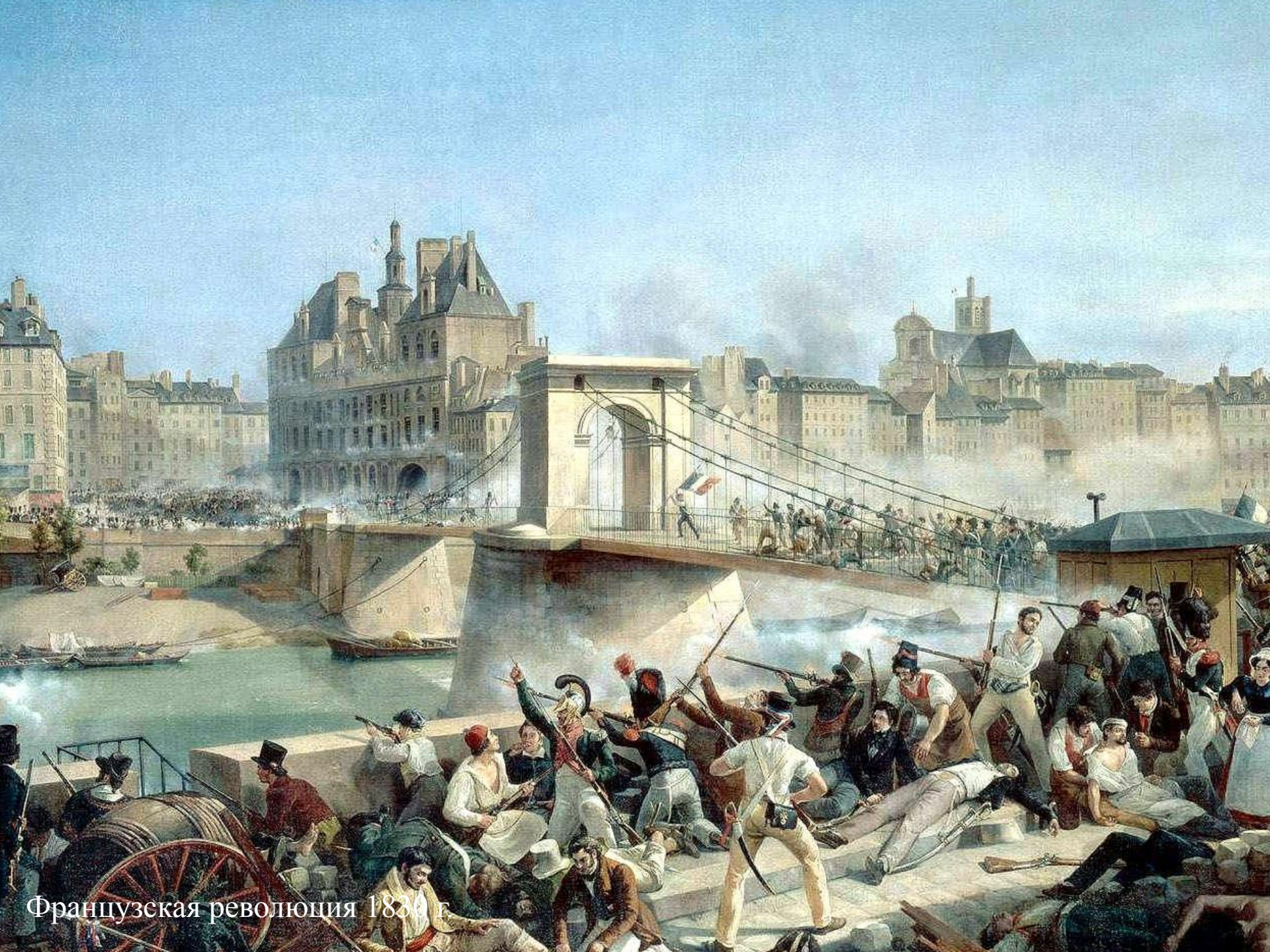
Французская революция 1830 г