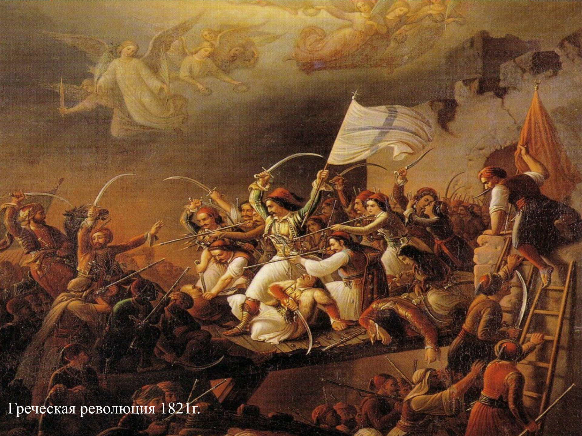
Греческая революция 1821г.