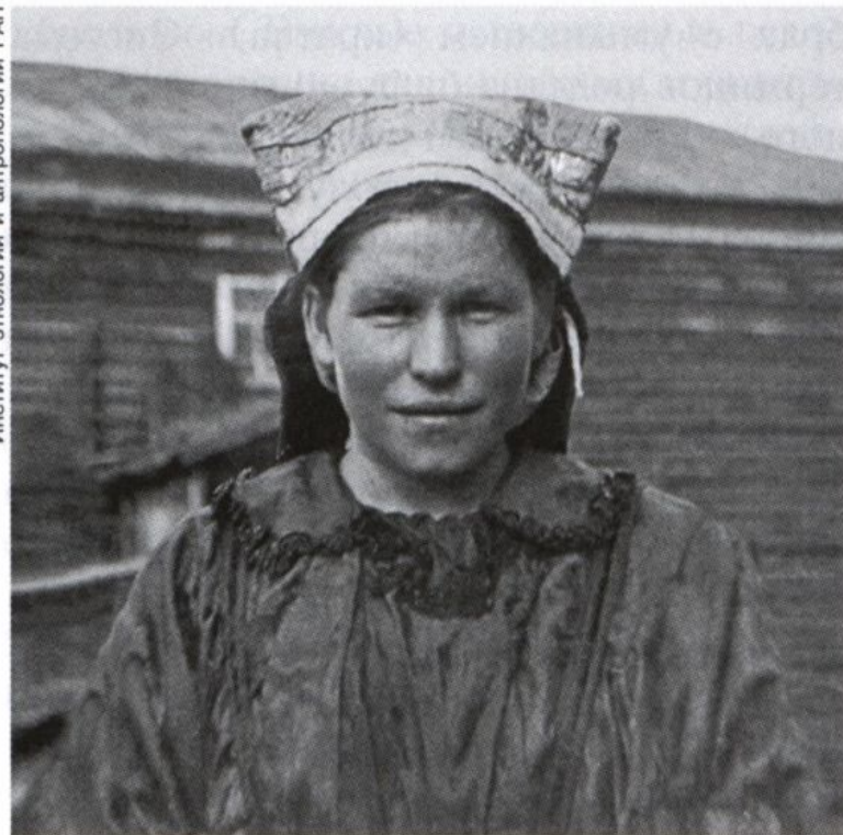
Молодая замужняя ижемка. Фото 1950.