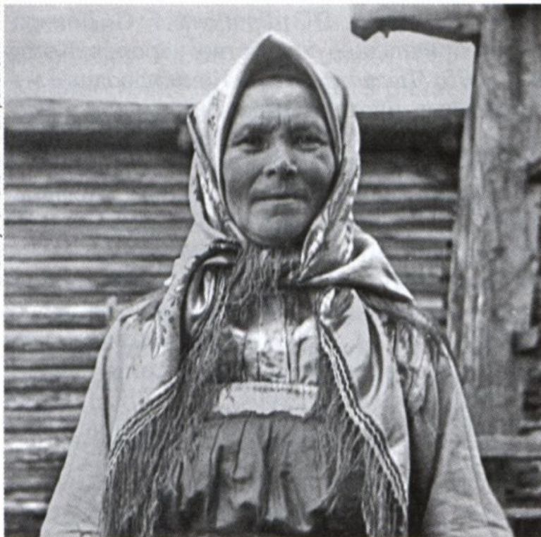
Пожилая женщина коми в традиционной одежде. Фото 1952.