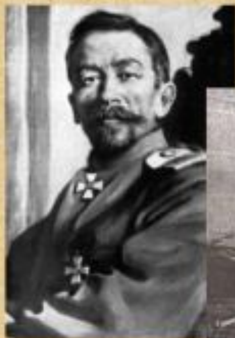
Лавр Георгіевич Корнілов