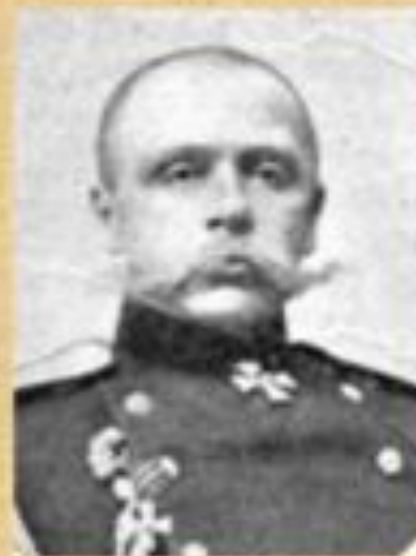
РЕННЕНКАМПФ Павел- Георг Карлович фон