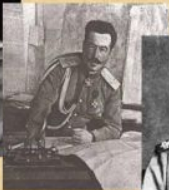
Никола́й Никола́евич Духо́нин