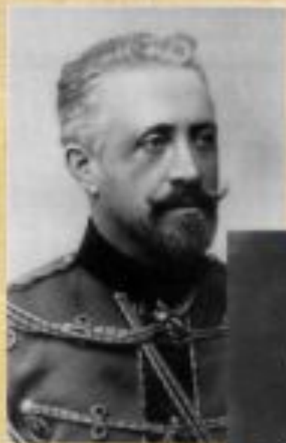
Великий князь Николай Николаевич