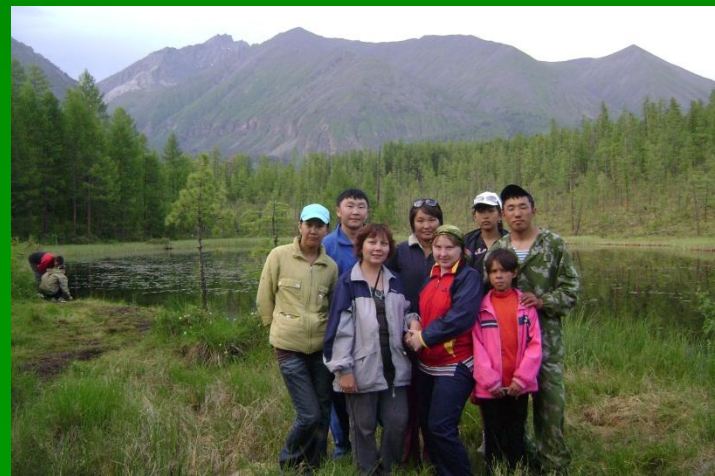
«һалаа харгы» Место нашей первой ночёвки