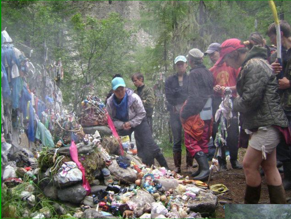
выход до «Хуухэн- хада»