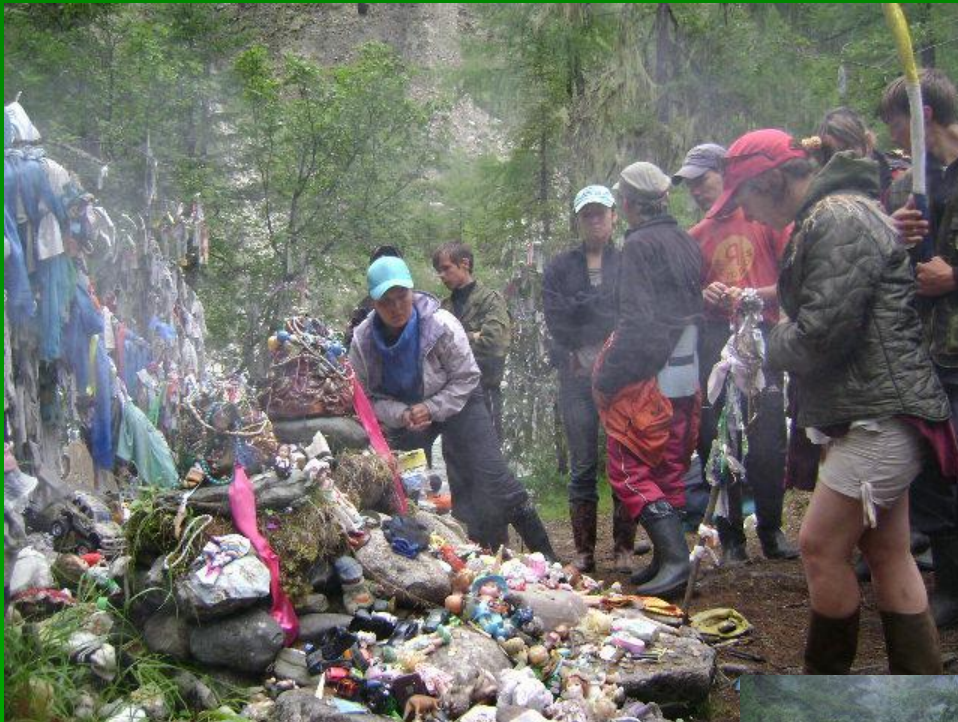
выход до «Хуухэн- хада»