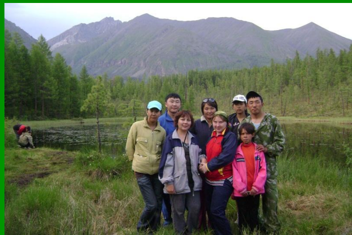
«һалаа харгы» Место нашей первой ночёвки