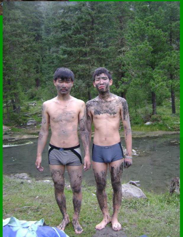
Будем здоровы и красивы!