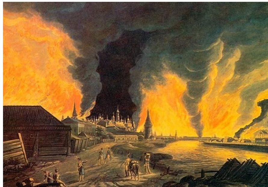
2-6 сентября (14-18 сентября) - пожар Москвы