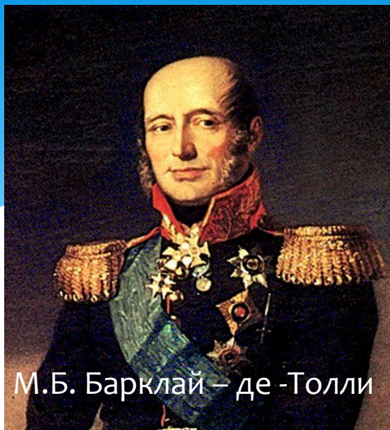
М.Б. Барклай – де -Толли

Русский полководец и военный деятель, генерал-фельдмаршал (1814г.), один из четырех полных кавалеров ордена Святого Георгия. На военной службе с 1776г. Главнокомандующий 1-й Западной армией в начальный период Отечественной войны 1812 года, а в июле-августе фактически всеми действующими русскими армиями. Сумел успешно провести отвод войск и объединить усилия 1-й и 2-й Западных армий против армии Наполеона. В Бородинском сражении командовал центром и правым крылом русских войск.