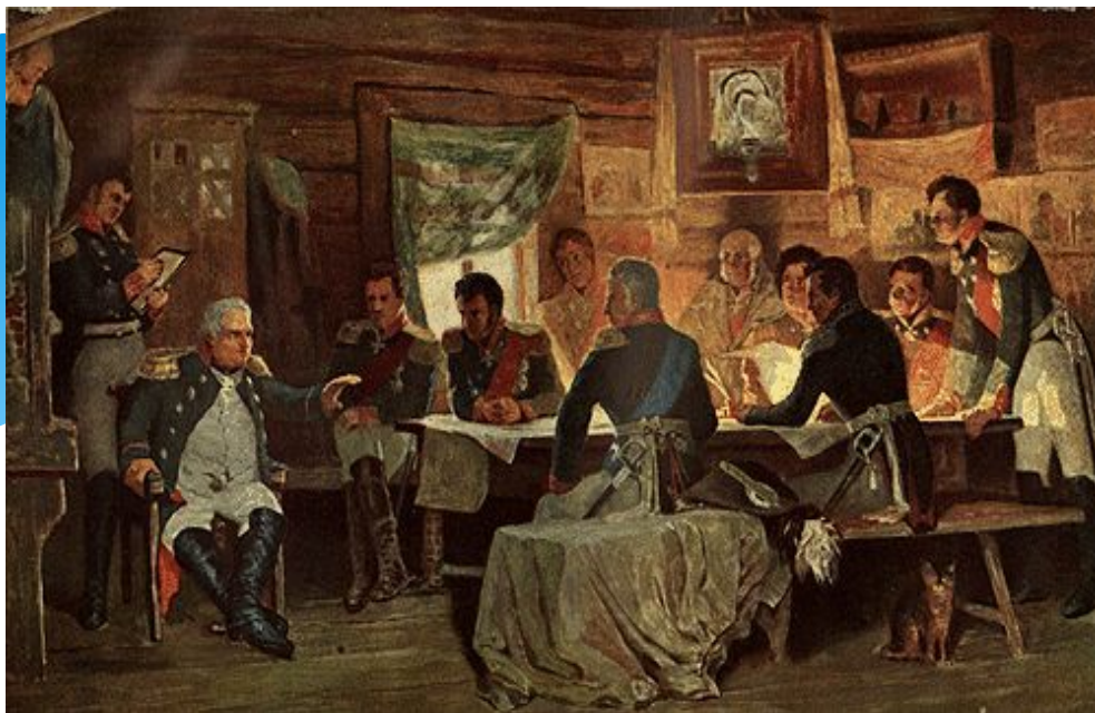
1 (13) сентября 1812 года - Военный совет в Филях