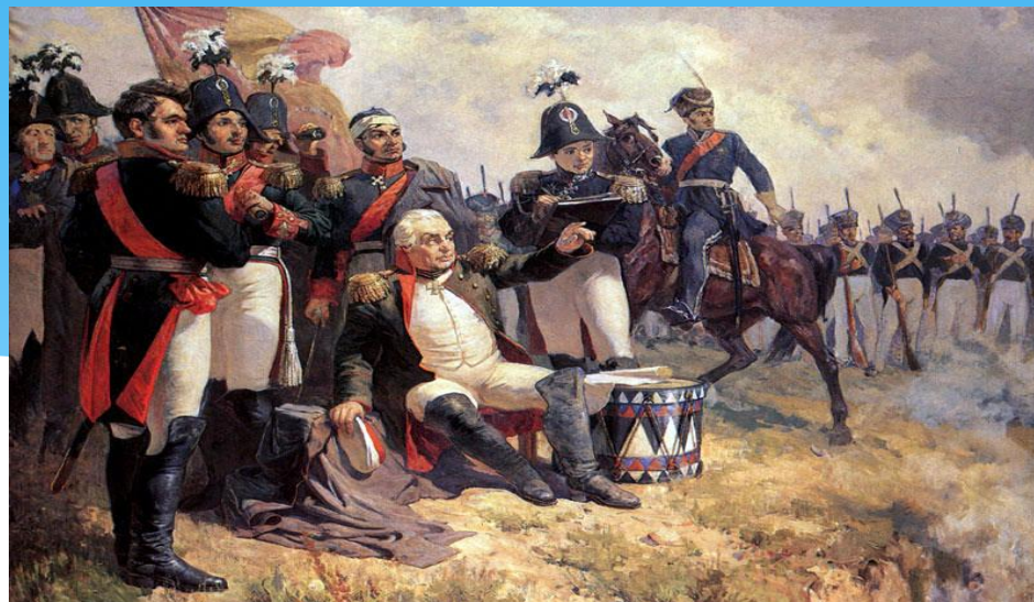
7 сентября (26 авг.) 1812 года – Бородинское сражение