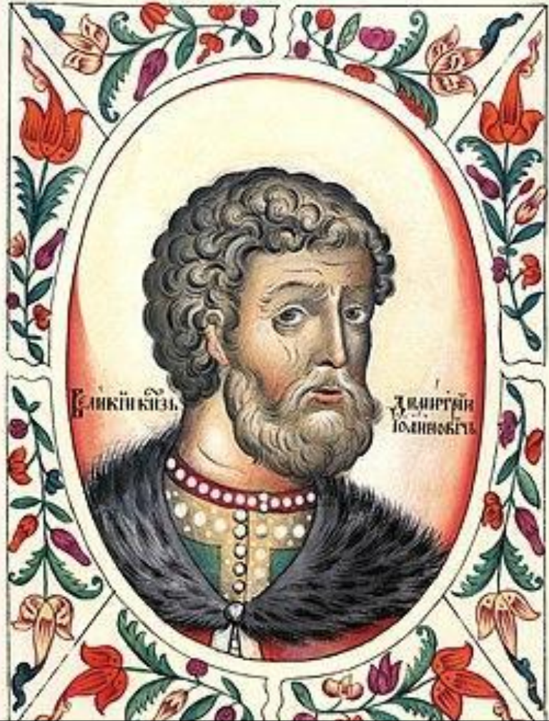
Дмитрий Иванович Донской (1359-1389 гг.)