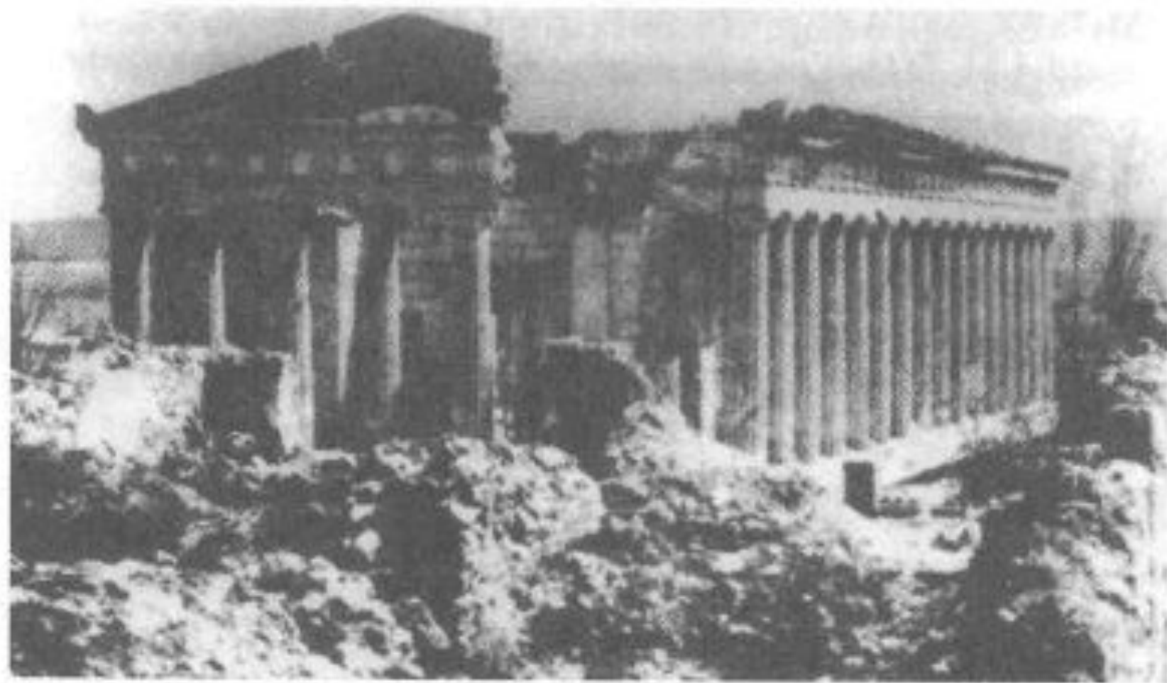
Разрушенный собор. 1855 г.