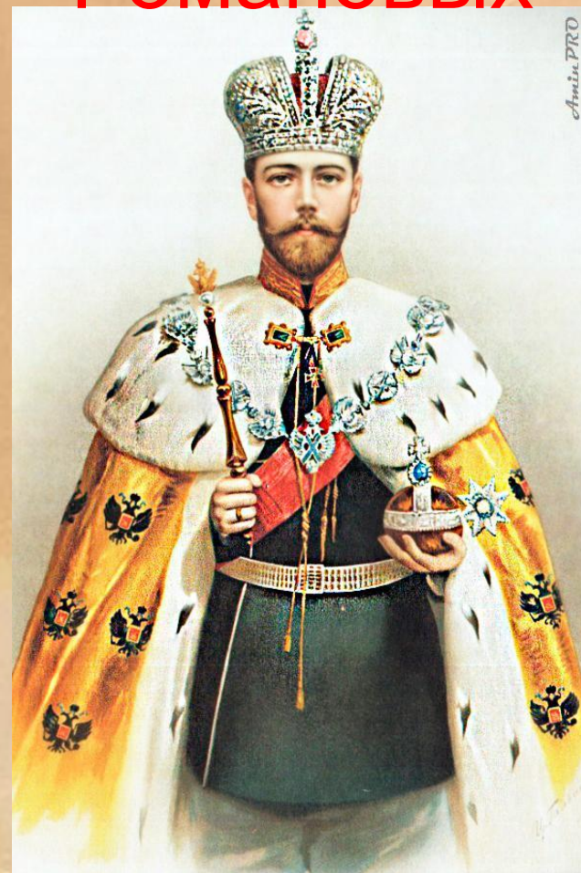
Николай II Александрович