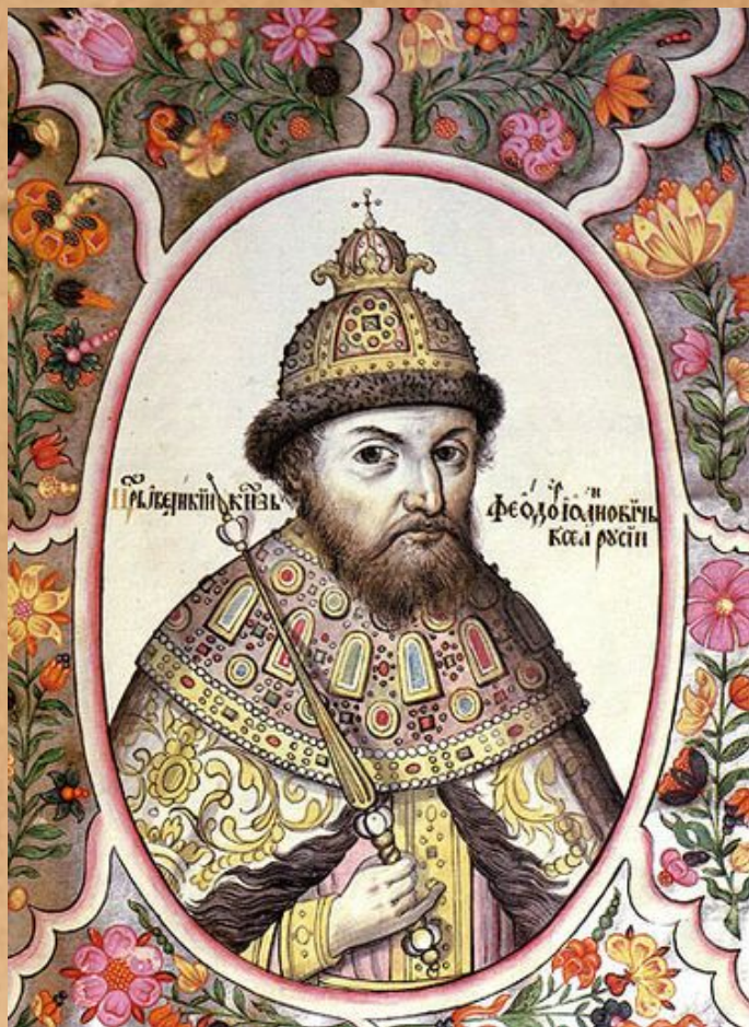
Фёдор I Иоаннович