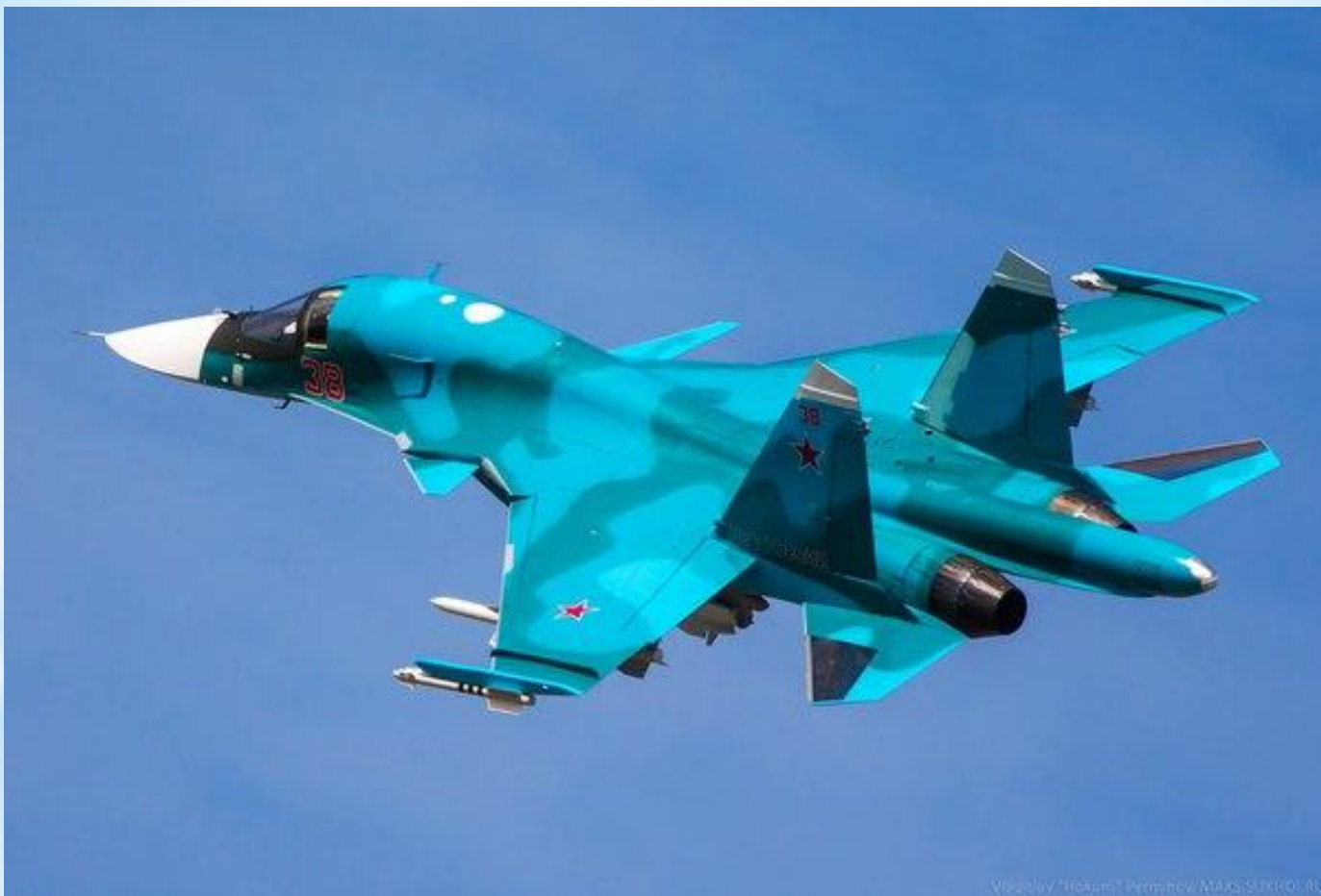
Су-34 - Российский многофункциональный истребитель-бомбардировщик