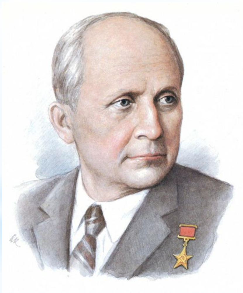
Павел Осипович Сухой 1895-1975