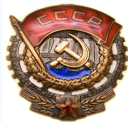
Орден Красного Трудового Знамени