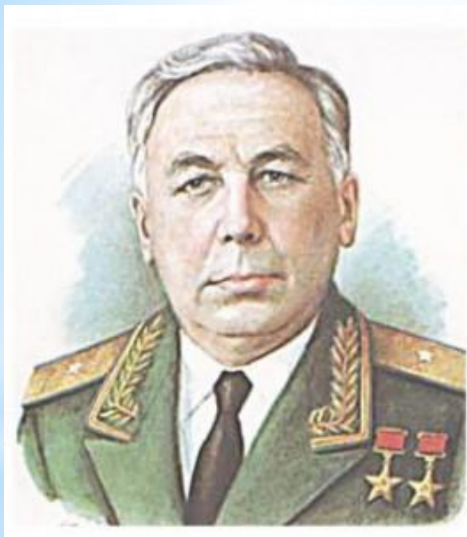
Семён Алексеевич Лавочкин 1900-1960