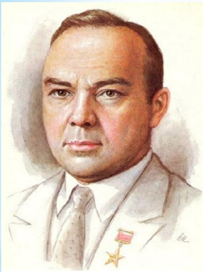
Николай Николаевич Поликарпов 1892-1944