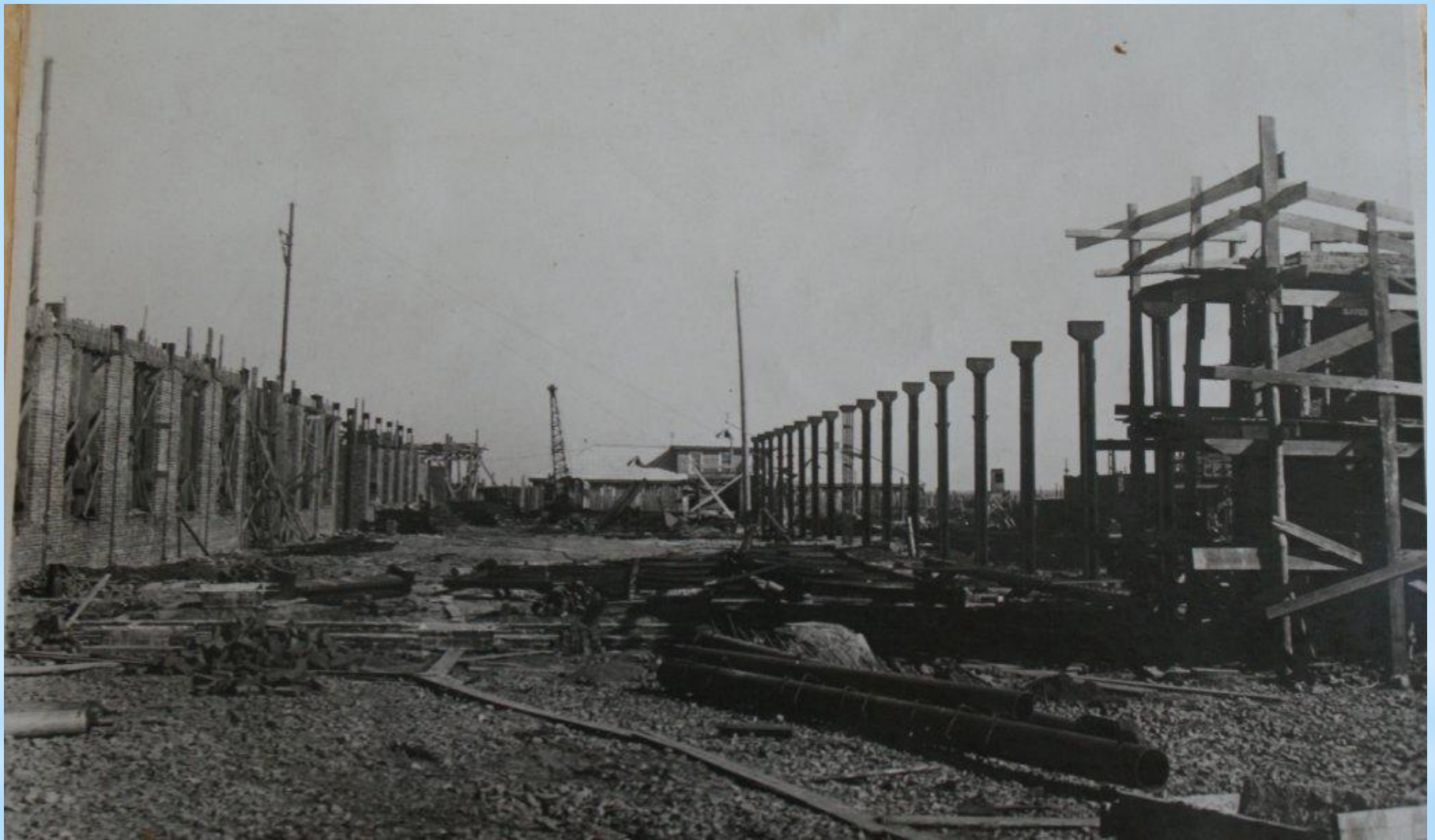
Строительство заводских корпусов 30-е годы