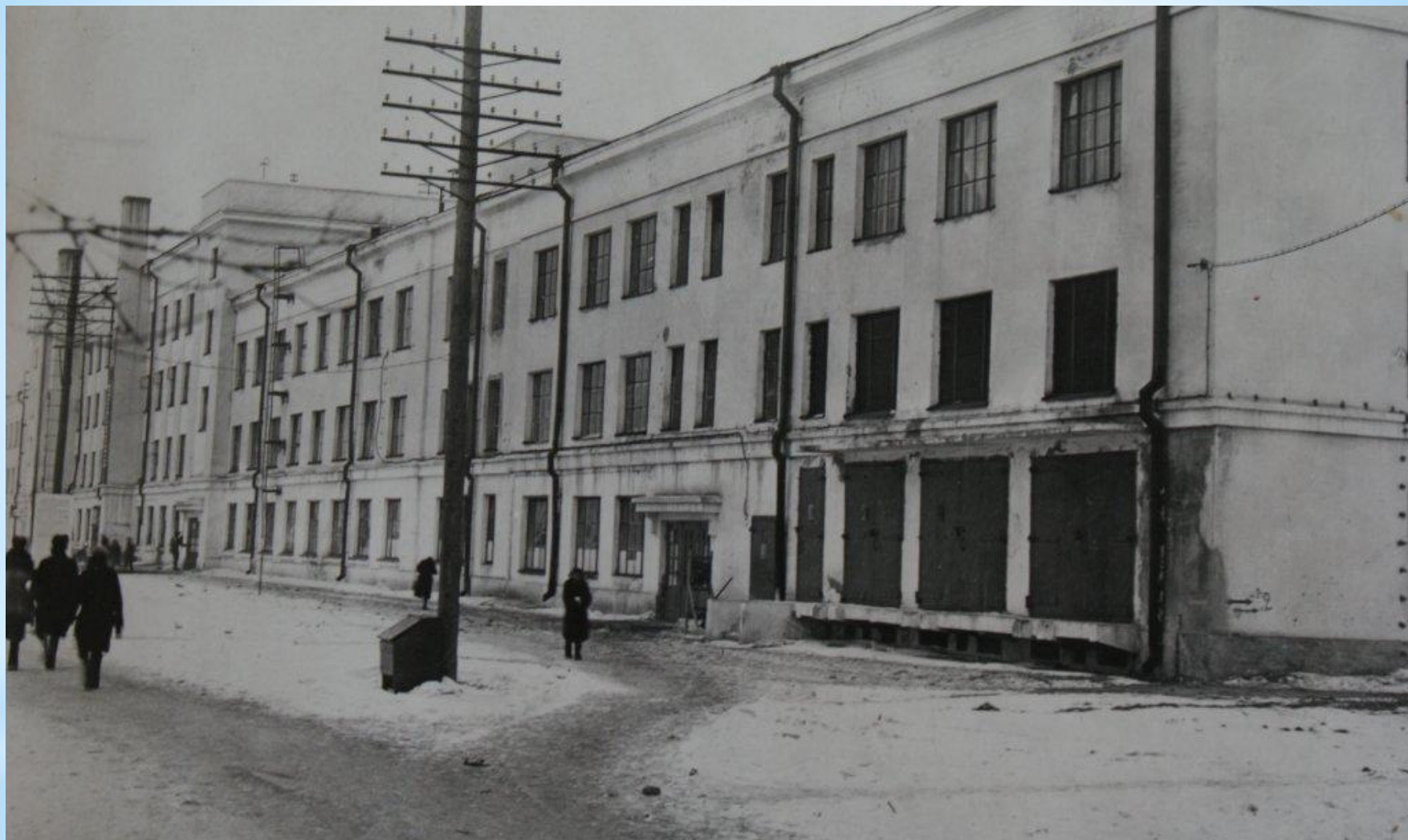
Один из первых производственных корпусов