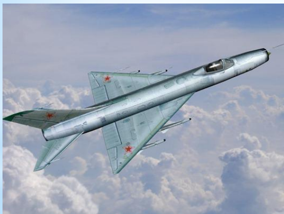
СУ - 9