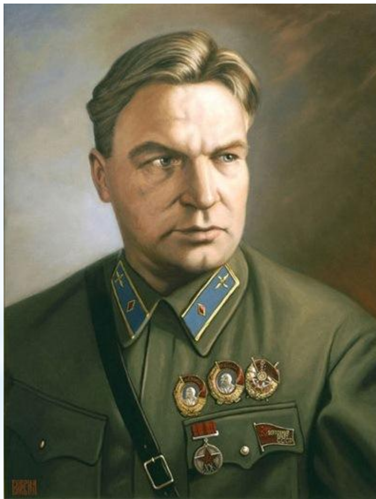
Валерий Павлович Чкалов 1904-1938