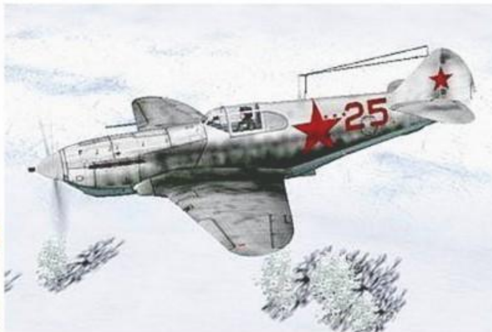
ЛАГГ - 3