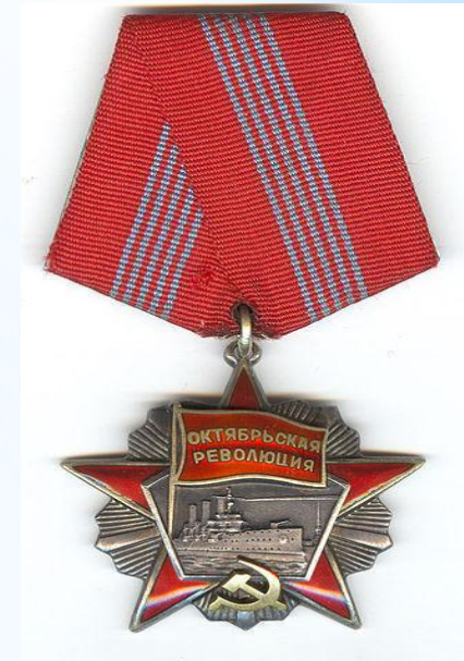
Орден Октябрьской революции