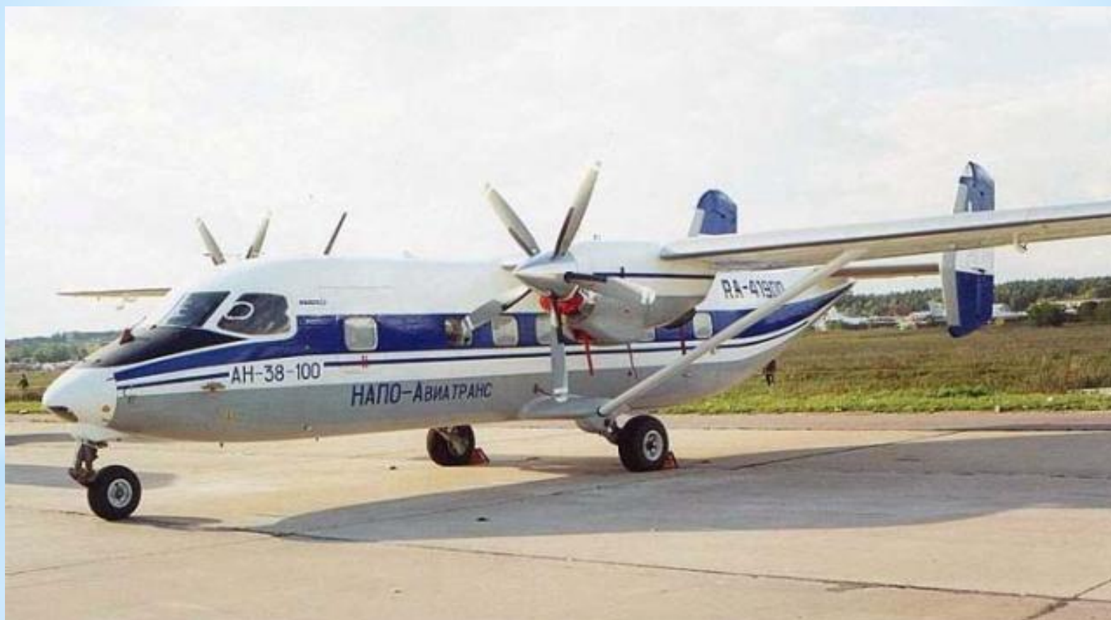
АН - 38 - Гражданский самолёт