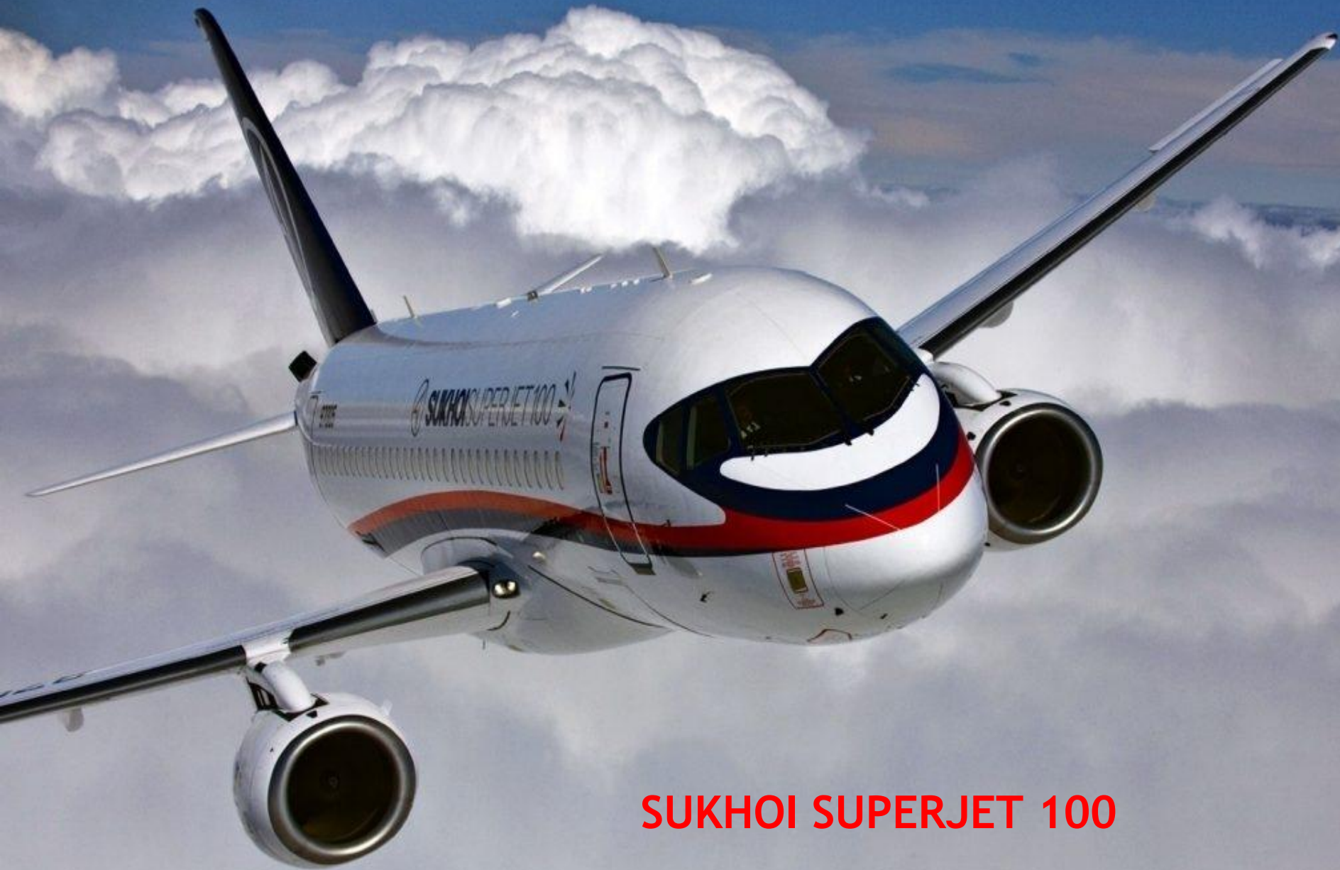
SUKHOI SUPERJET 100