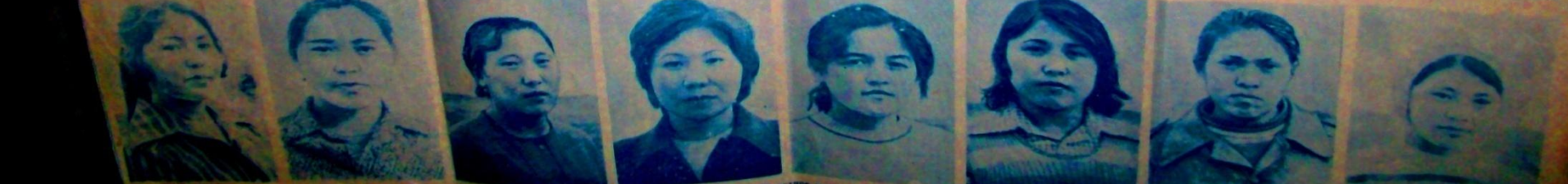
Управленки объединения колхозов. Основным профсоюзом объединенной сельхозной А. В. Основными управлениями сельхозной А. В. Основными управлениями сельхозной А. В.